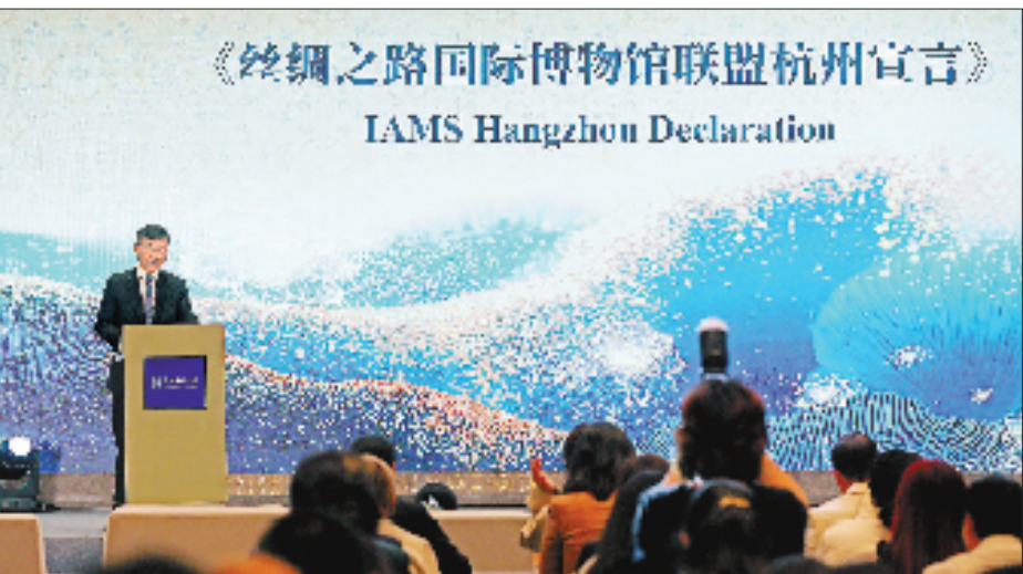
图为“薪火相传:博物馆功能拓展与文物活化利用”分论坛现场。