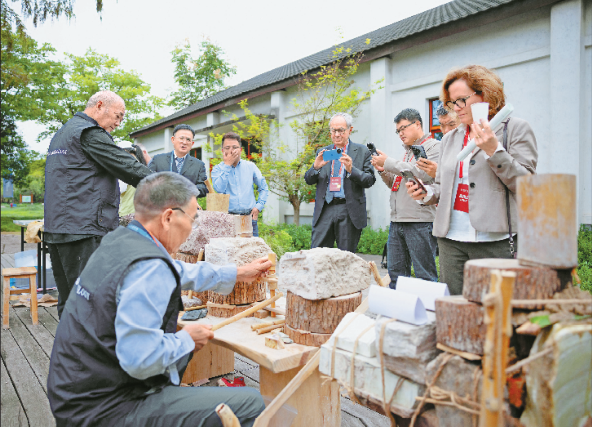
“实践创新:城址考古、大遗址保护与城乡协同发展”分论坛间隙,中外专家观看复原石器工艺制作良渚玉器的过程。

活动,核心目标是提高人们对周边原住民社区的认知,保护玛雅语言。同时对旅游从业者进行培训,确保他们能正确宣传并保护遗址。通过这些努力,我们在为原住民社区提供支持,彰显其价值。 奇琴伊察不仅是墨西哥的国家象征,更是全人类共同的财富。我们致力于在保护与利用之间取得平衡,使其持续发挥文化、社会与经济价值。 (本报记者 戴欣怡 纪驭亚 整理)