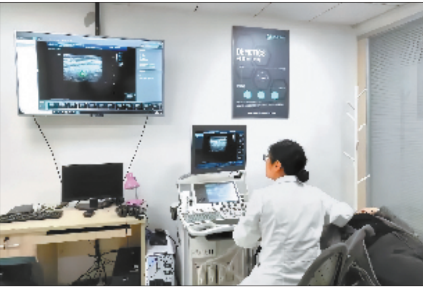
“DE超声机器人”入驻杭州市西湖区蒋村社区卫生服务中心后,不少患者专程从外地赶来作超声诊断。

预约挂号源向基层下沉、中高级职称医师值守、深化“一老一小”健康管理服务、延长社区门诊服务时间、建设智慧流动医院……浙江以基层为突破口,通过“双下沉、两提升”工程、县域医共体改革、医疗卫生“山海”提升工程、高水平县级医院建设等一系列重大举措,不断提升患者从“病有所医”到“病有良医”的就诊体验。