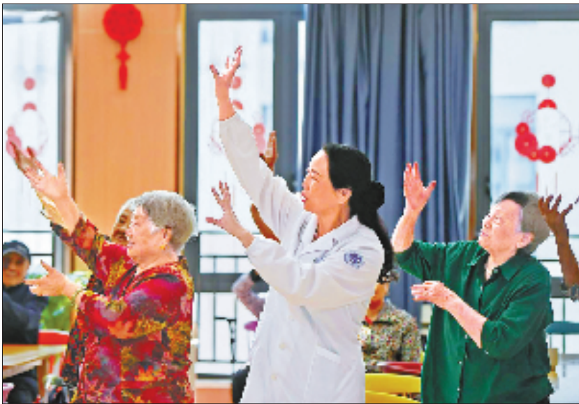
金华市金东区多湖街道社区卫生服务中心医养中心,护士和住院老人一起做健身操。

带移动CT等设备深入基层,服务群众逾万万名;还通过“名医家乡行”活动遴选籍贯地专家,由院领导、科主任带队下乡,显著提升了偏远地区巡诊覆盖与实效。该院常务副书记虞洪建议,构建全省“长期定点帮扶+定期巡回医疗”的格局,同时将5G大型义诊灵活穿插其中,携带移动CT等高科技设备深入基层,为患者节省往返医院的时间和精力。