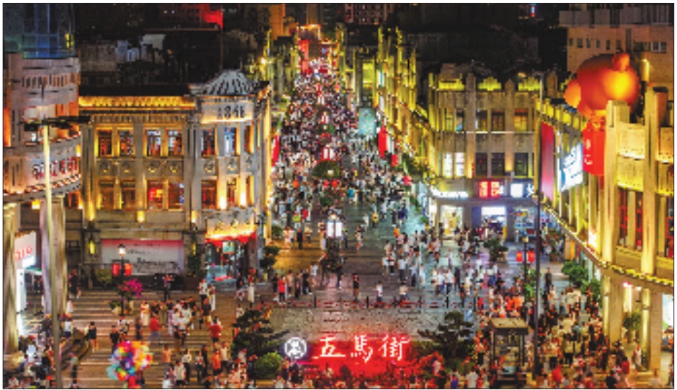
国庆假期,温州五马街游人如织。