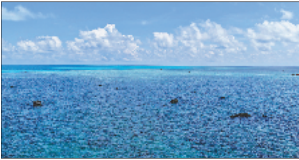
10月2日拍摄的黄岩岛礁盘露出水面的礁石。