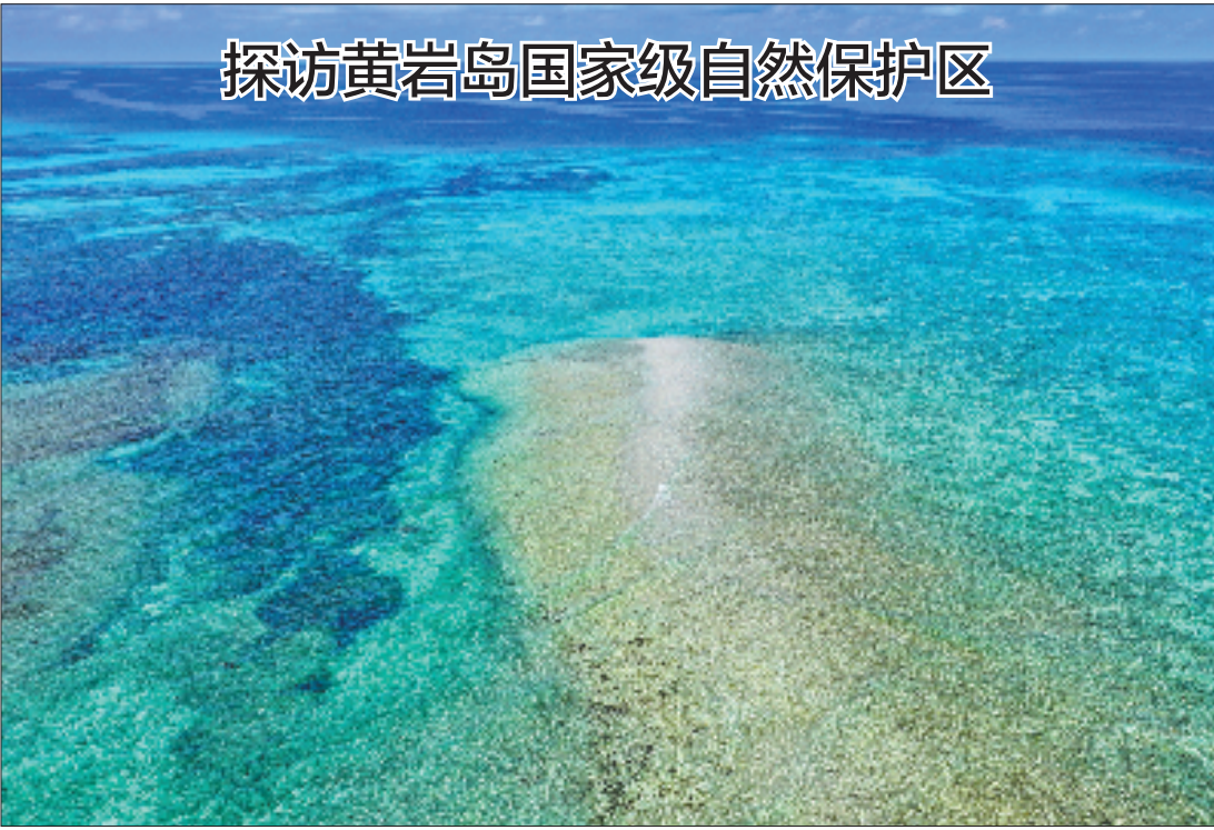
探访黄岩岛国家级自然保护区

镇河段水位将继续上涨0.5米左右，出现超警3.5米左右的洪水（警戒水位140.5米）；干流龙州县城河段水位将继续上涨1米左右，出现超警5米左右的洪水（警戒水位117.2米）；干流崇左市区至扶绥县城河段水位将继续上涨3米左右，其中崇左市区河段出现超警5米左右的洪水（警戒水位101.2米），扶绥县城河段出现超警4米左右洪水（警戒水位81.8米）。郁江南宁城区河段至贵港城区河段水位将继续上涨2米左右，其中南宁城区河段出现超警3.5米左右的洪水（警戒水位73.0米），贵港城区河段出现超警3米左右的洪水（警戒水位41.2米）。