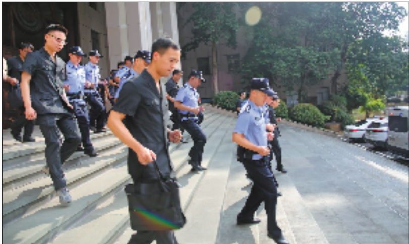
金华中院开展执行行动。