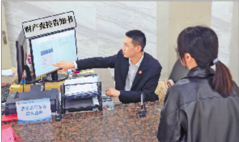
法官向当事人介绍“三张清单”。

“金华中院‘三张清单’的做法已向全省法院推广。”省高院执行局相关负责人表示,“三张清单”执行公开改革是完善执行监督制度的有益探索,能有效解决执行信息不对称、失信失能甄别难等问题,防范廉政风险,让执行更规范、过程更透明、群众更信赖。