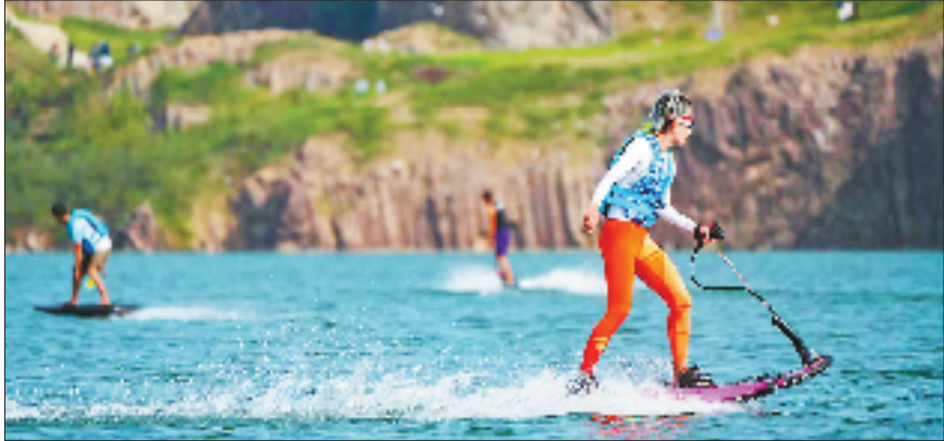
国庆中秋假期，在海宁市袁花镇神仙湖生态公园，尾波冲浪与牵引式滑翔艇两大新潮运动联袂亮相。