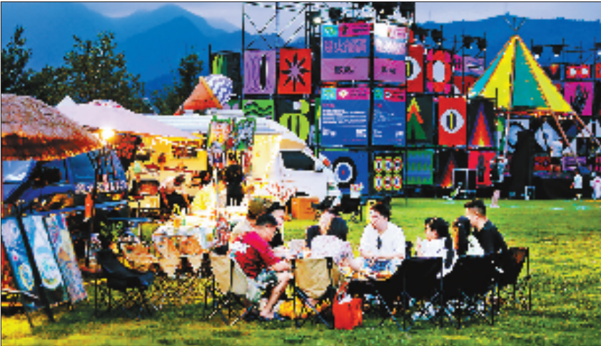
游客在品尝各式咖啡美食。

现场，近百辆风格迥异的咖啡车依次排开，手冲咖啡、创意特调、传统意式、冷萃咖啡……来这里，游客不出远门就能喝遍全国咖啡。待到夜幕降临，在咖啡醇香中，火舞剧、乐器演奏等表演交替上演。此起彼伏的欢呼声，点燃