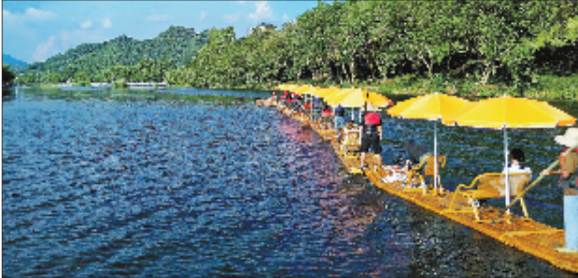
10月5日清晨，开化马金溪上，十余条竹筏满载欢声笑语徐徐前行。

10月5日，记者走进安吉县天荒坪镇余村瀑布咖啡，恍如来到了热带丛林。2004年，余村全面关停矿山，对冷水洞矿坑进行复垦复绿。近年来，当地以矿坑生态修复为核心，整合咖啡、悬崖餐厅、水上划桨、音乐吧等多元业态，打造沉浸式自然体验空间。