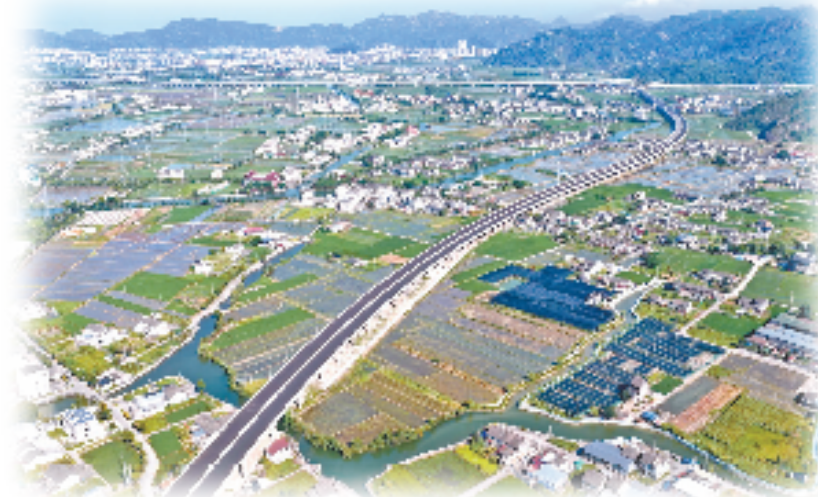
瑞苍高速建设中的括山桥

去年暑期，浙产游戏《黑神话：悟空》风靡海外，创下了多项国产游戏出海纪录。游戏取景地——丽水市景宁县大漈村由此出圈，迅速成为游戏迷打卡的网红景点。承载这一“泼天”流量的，正是由浙高建公司建设的景文高速。