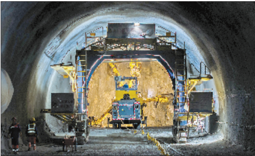
义龙庆丽水段牛头山隧道钻孔施工