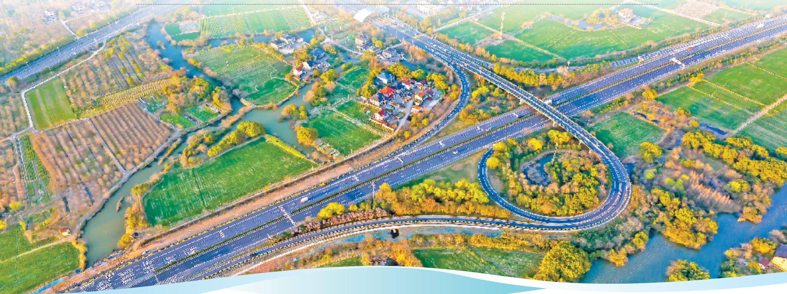
申苏浙皖改扩建项目长兴西互通

东海之滨、长三角南翼，浙江正以海陆空铁“四维网格”重塑时空格局，书写“交通强省与世界一流强港建设”的辉煌篇章。作为交通强国建设全领域、全方位试点省，浙江以“试点即突破”的魄力，推动交通从“基础保障”向“发展引擎”跃升，不仅破解了“山海阻隔”的发展难题，更铺设了一条条通向共富的黄金坦途。 站在“十四五”圆满收官、“十五五”蓝图初绘的关键节点，浙江交通集团肩负“高水平服务人民美好出行，高质量发展综合交通产业”的使命，牢固树立“挑大梁”的责任担当，深入落实“千项万亿”工程，服务交通强省建设，努力为全省大局多做贡献。 “十四五”以来至今年8月底，浙江交通集团累计完成交通基础设施投资3703亿元，较“十三五”时期增长26.5%，先后主导投资新建成宁波舟山港主通道、杭绍甬高速杭绍段等高速公路项目344公里和改扩建项目137公里，控股或参与建成湖杭高铁、杭温高铁等铁路项目1086公里。作为集团旗下高速公路建设的主力军之一，浙江交投高速公路建设管理有限公司（简称“浙高建公司”）全力推进高速公路投资建设，“十四五”期间已累计完成投资836.26亿元，其中，建成通车的景文高速等3个项目总里程达187公里，杭金衢改扩建二期项目总里程137公里，为之江大地绘制出一幅波澜壮阔的交通画卷。