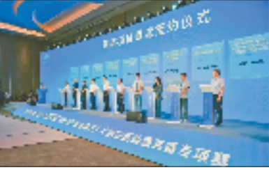
获奖项目赋能签约仪式

请院士专家作前沿技术报告等，为嵊州打造新能源装备“万亩千亿”新产业平台、优化产业结构注入更多活力。