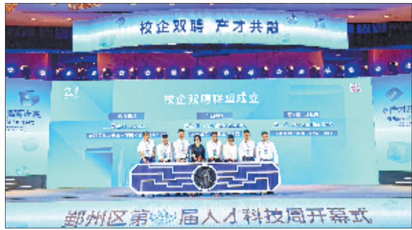
鄞州区第4届人才科技周开幕式现场

2023年以来，鄞州区率先推出区级技术创新挑战赛，聚焦技术难题攻坚，畅通重大科研成果产业化“最初一公里”。截至目前，该区推动奥克斯、圣龙集团等23家企业与中科院材料所等高校院所缔结合作，撬动企业研发投入1.36亿元，新增产值2.3亿元。2025年6月，“技术创新挑战赛驱动协同攻关机制改革”成功入选省教育科技人才一体化改革专项试点。