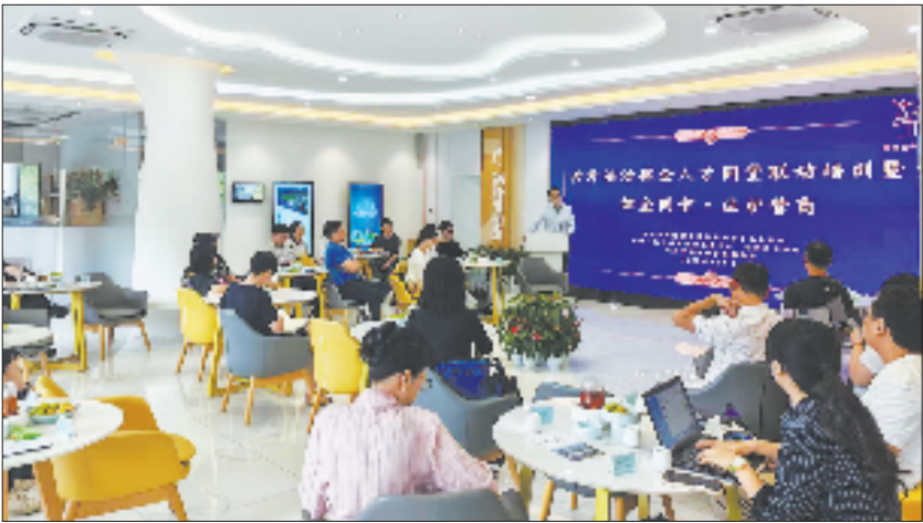
涉外法律企人才同堂联动培训

江大学、浙江外国语学院等高校资源,共建“青年(涉外)律师成长学院”,开设国际商事仲裁等专业课程,连续2年举办外语演讲比赛,推出“国际化律师精英计划”,每年选拔一批优秀青年律师赴海外参加高端涉外研学,拓展国际业务网络,提升跨文化法律服务能力,在全区培养储备涉外法治人才220余人。 为强化实践锻炼,在高校创新带设立3个“一站点一团队”式服务站,成立西湖区“涉外公益法律服务团”“侨企出海法律顾问团”和“涉侨商事调解团”,为侨资企业和有出海需要的企业提供前沿、精准的法律资讯和风控指引,并通过“律企同堂培训”强化涉外法治人才实战实训。截至目前,围绕出海合规、境外上市、跨境知识产权、文化出海等主题组织