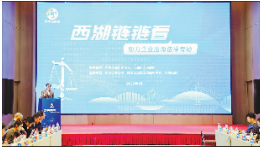
西湖链链看:助力企业出海法律专场