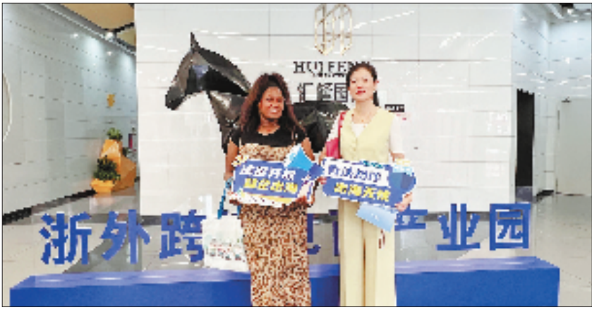
西湖区“法促开放 益企出海”法律服务进园区活动

专题培训4场,覆盖重点企业60余家,累计培训律师、企业法务150余人次。 正是通过这样的锤炼,一支由青年律师牵头的“庭内庭外”普法展演团队应运而生。他们精心编撰“模拟法庭”系列普法剧目,将沉浸式普法教育从市纪委市监委、市委党校等单位延伸到交通执法一线,累计展演21场次,受众超1300人。 律所也立足专业优势,差异化布局国际资源,持续提升涉外能力。浙江六和律师事务所联合多方主办“企业出海知识产权国际视野座谈”,汇聚10国专家研讨;上海兰迪(杭州)律师事务所特邀省律协专家分享“涉外律师的能力谱系及发展路径”,从语言能力、跨文化交流能力、国际法律知识等方面促进律师交流合作。这些经实训淬炼、具国际视