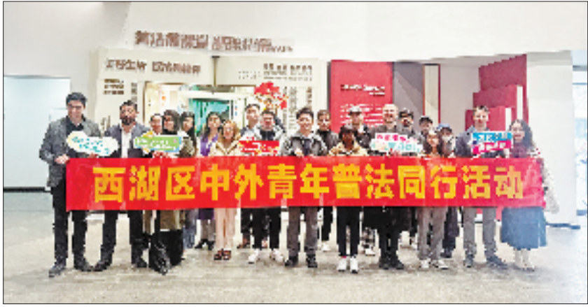
西湖区中外青年普法同行活动

今年7月,随着黄龙法务集聚区正式启航,西湖区以法治护航企业“走出去”的战略布局再落关键一子。与今年4月启动的之江法务集聚区一起,两大集聚区错位发展、协同发力,形成了西湖律师行业“双引擎”驱动的新格局,这标志着西湖区成功构建起覆盖企业出海全生命周期的法律“护航舰队”。集聚区汇聚了天册、六和、京衡、金道等超50家知名律所、2400余名专业律师及50余家泛法律服务机构,宛如一艘强大的“法律航母”,为企业提供全生命周期法律护航。通过深度链接高校、平台、仲裁、公证等资源,西湖区正着力打造一个“立足浙江、辐射长三角、面向全国、链接全球”的区域高端法律服务新地标。 这个生态圈的核心是激活国际法治对话,“与中国律师合作是一个很好的机会,可以共同推动法律事业的发展。”在西湖区青年(涉外)律师成长学院组织的“中外青年说”活动上,一位厄瓜多尔