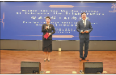
西湖区第二届青年律师外语演讲比赛

从搭建高端生态圈汇聚全球资源,到实训淬炼国际视野的法律“精英队”,再到线上线下联动破解企业“出海烦恼”,西湖区正以法治“组合拳”为企业闯荡世界保驾护航。这股强劲的“西湖法治动力”,正在为中国企业扬帆远航注入更多信心与底气。