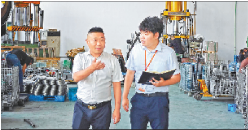
宁波银行金华分行走访企业收集数据做好“生产圈”服务