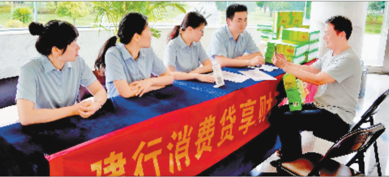
建行金华分行向消费者宣传个人消费贷款优惠政策

依托“智慧+”收单系统高兼容性、可定制化优势，工行金华分行攻坚商贸项目，打造综合服务标杆。由该行各支行组建专项“商圈营销小组”，重点对金华市区西市街、古子城、三江里商圈开展营销，为商户量身定制“收单+促销+普惠”产品组合，助力商户提升经营效益。同时，围绕国庆、中秋等消费节点，遴选重点商圈50家以上核心商户，推