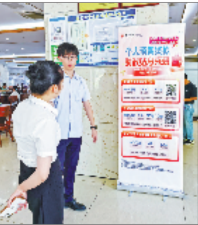
中行金华市分行向消费者宣传个人消费贷款优惠政策

宁波银行金华分行在激活消费潜力方面，借助平台蓄力，精准构建消费助企新生态。该行围绕“抢机遇、抓项目、助企业、提消费”经济工作主线，持续聚焦客户消费热点和区域特色，精准蓄力，围绕“生产圈”“生活圈”不断升级场景生态。“生产圈”内，积极联动相关部门创新推出“设备之家百城购机节”活动，在“设备之家”平台上设立“金华专区”，引进金华本土机床设备厂家，并精选超300个全国大牌设备，实现设备互通。“生活圈”内，链接超700家知名本土企业入驻“美好生活”平台，通过常态化特色活动，为全城超20万市民提供覆盖美食商超等20个主流场景的消费优惠，并通过“特卖会+配套引流”的方式，带动本土企业品牌曝光、拓展销路，截至目前，累计带动本土企业平台成交额破800万元。