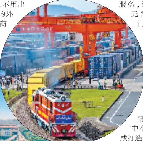
中欧班列

成打造全场景、全链路、数字化的综合贸易服务平台。此外,“保税+直播”“集拼仓+中欧班列”等创新场景也持续发力:义乌综保区跨境进口直播基地2025年上半年带动美妆、母婴进口额4.83亿美元,时效较传统模式提速26%,让“义乌小商品”真正实现“买全球、卖全球”。