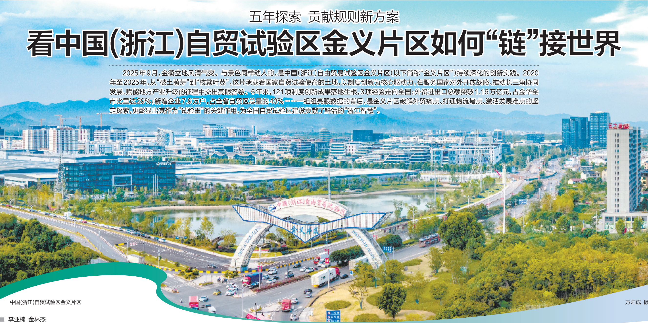
中国(浙江)自贸试验区金义片区