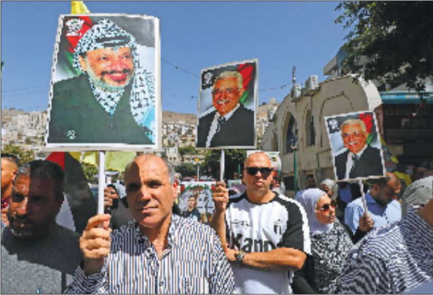
9月23日,在约旦河西岸城市纳布卢斯,民众挥舞巴勒斯坦领导人阿拉法特和阿巴斯画像参加庆祝活动。