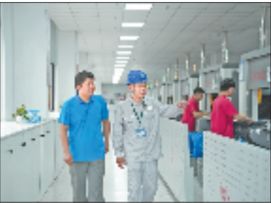
电力工作人员前往温州市瑞星鞋业有限公司开展现场服务

从家庭作坊到小微企业，从外贸制造到绿色转型，在电力赋能民营经济的征程上，国网温州供电公司始终以客户为中心，以创新为动力，以服务为己任，为民营企业行稳致远、发展壮大注入电力动能。