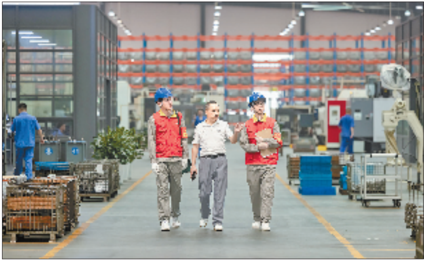
电力工作人员前往海特克动力股份有限公司开展现场服务

国网温州供电公司精准把握这一需求，全面落实低压用户“三零”服务，推行160千瓦及以下小微企业低压接入，将投资界面延伸至用户表计，真正实现办电“零投资”。今年，该政策已为超1.1万户低压用户节省投资超过1400万元，有效激发“草根经济”活