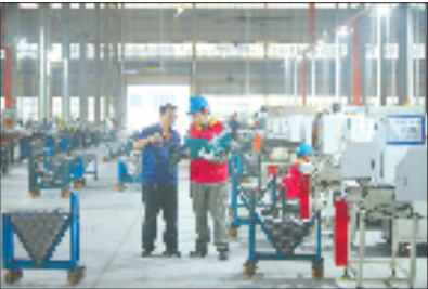
电力工作人员前往浙江亚之星汽车零部件有限公司指导用户优化用电方案