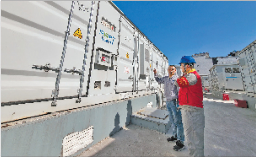
电力工作人员前往瑞浦兰钧新能源制造基地开展用户侧储能设备现场用电检查服务

平阳县水头镇的转型故事更是深刻印证了“人民电业为人民”的服务初心。曾经的水头镇以“中国皮都”闻名