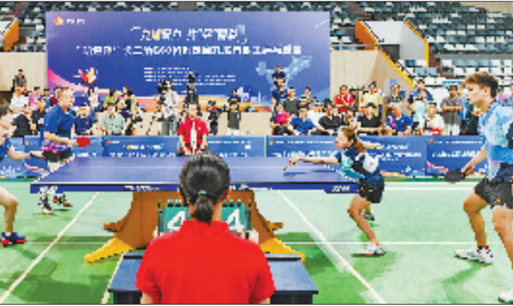
9月19日至20日,“凯巡杯”长三角G60科创走廊九城市职工乒乓球赛在金华市精彩开赛。

活、凝聚奋斗干劲的重要抓手。通过持续推进职工活动阵地建设,组建多元化职工文体兴趣小组,打造“百万职工来健身”系列文体赛事等举措,不断丰富职工文化体育生活,切实提升职工的获得感与幸福感。