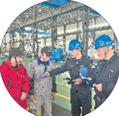
基层部门到企业一线解决问题

“从保障企业用电，到压缩审批周期，再到辅导税收优惠……在这儿，没有‘这事不归我管’，只有‘这事应该办’。”翻开暖企办负责人的工作台账，一列列已办结事项清晰可见。3年来，定海累计派驻专员34人次，实现新落地亿元重点项目全覆盖，解决各类问题超1300个，“暖企工程”创新工作还作为舟山市唯一案例，入选全省营商环境优化提升第三批最佳实践案例。