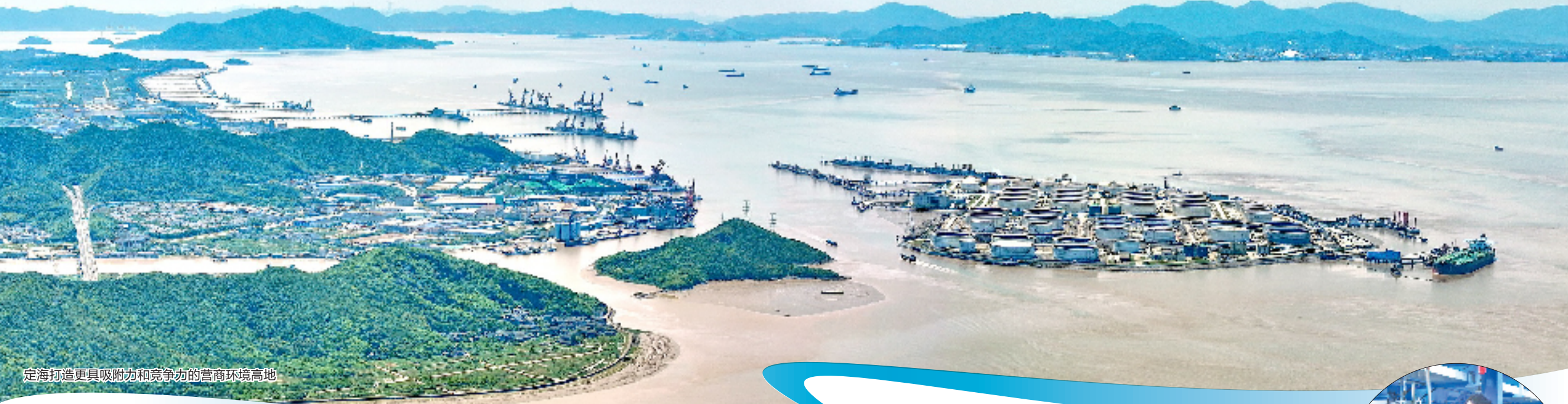
■ 周杭琪 韩地枰 康明军

东海之滨，潮声激荡。改革，深植于舟山定海血脉，是这座城市发展进程中强劲的脉搏。 如今，这座致力于产业升级转型的海上千年古城，又一次走出“舒适区”，于企业服务、审批效能、市场准入等领域深化变革，率先蹚出一条营商环境优化提升的“新路径”—— 2022年起，定海选派暖企专员深入企业生产经营一线精准对接需求、传递服务温度，更通过“我为企业发展办一事”“一企一服务”等刀刃向内的机制创新，形成跨部门协同攻坚的网状服务格局，推动政府助企方式从最初被动响应、碎片化服务，升级为全链条、专业化的生态体系，为营商环境优化注入强劲动力。 3年来，暖企专员累计为企业破解各类发展难题 1300 余个，“我为企业发展办一事”已累计推出 4 批次 35 个服务事项，“有求必应、无事不扰”成为定海为企服务的代名词。 从经验导向迈向机制引领，这场“前端一线直达、后端网状协同”的立体化服务体系实践，正织就一张政府与市场同频共振的服务生态网，推动现代化新定海建设再上新台阶，也为新时期基层优化营商环境、激发经营主体活力，提供了可复制、可推广的鲜活样本。