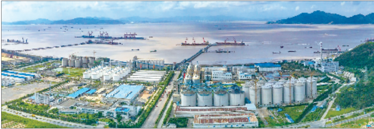
定海大宗商品储运能力持续提升