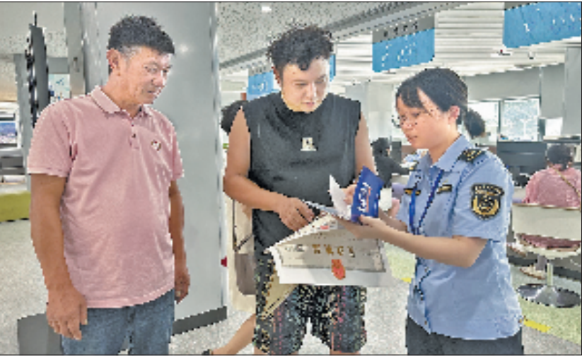
暖企专员帮助企业做好政企沟通

“不仅仅是一个指标，更是给企业发展松了绑！”日前，在舟山华康生物科技有限公司年100万吨玉米精深加工健康食品配料项目现场，看着热火朝天的生产场景，企业负责人很欣慰，“感谢定海暖企专员，一直为我们解决成长的烦恼。”