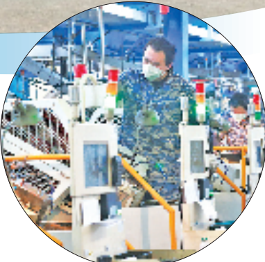
7412工厂等企业入选全省年度成长性最快百强企业

改革成效显现。今年以来，定海已成功促成两笔跨市交易，累计购得氨氮指标7.92吨、氮氧化物指标30.554吨，满足项目建设需求。