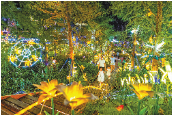
诸暨市枫桥镇“诸暨夜花园”主题灯光秀吸引市民、游客前来观赏。