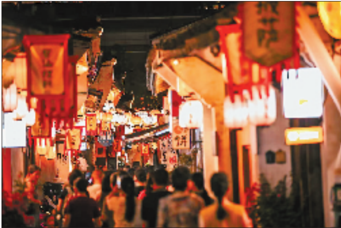
夜幕降临,衢州古城灯光璀璨、人声鼎沸。