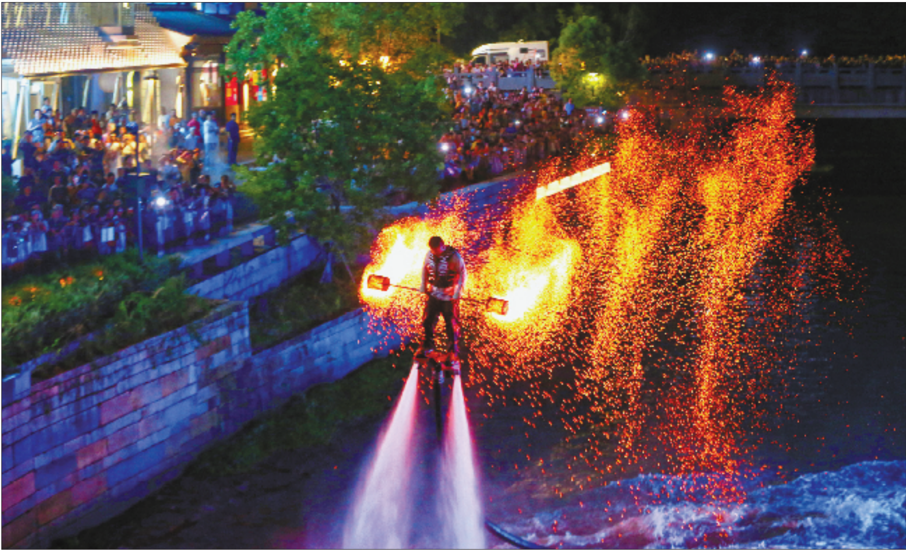
杭州祥符老街吉祥里打造多元夜间消费场景,引入“水上火壶”等非遗表演,吸引市民、游客驻足观赏。