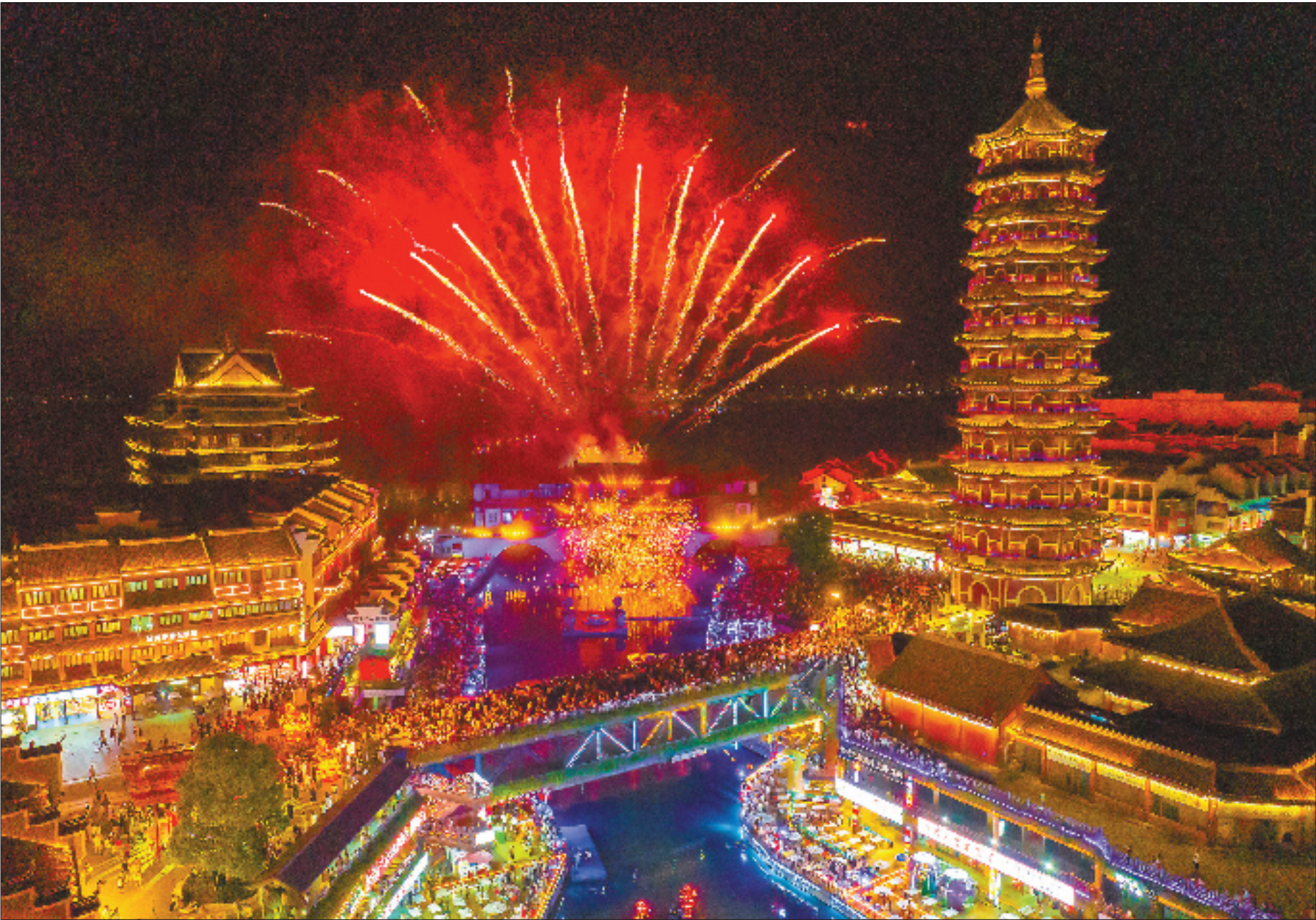
长兴县龙之梦太湖古镇内灯光璀璨,现场非遗“打铁花”、烟花秀和灯光音乐秀等项目吸引游客前来游玩观赏。

今年夏天,浙江持续打造“浙夜好生活”,省商务厅等12部门联合发文,推动“激情浙夏 快乐消费”。全省各地陆续推出系列政策点燃城市夜晚烟火气,如升级核心商圈灯光、延长商业体经营时间、创新文旅夜旅游线路等。截至目前,我省已形成36个夜间经济样板城市、9个特色城市。夜幕降临,浙江各地夜间消费场景不断“上新”,夜经济持续升温。