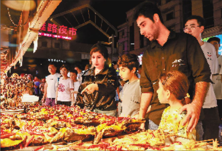
义乌市稠城街道三挺路夜市灯火通明,各国语言交织,不同面孔穿梭其间。