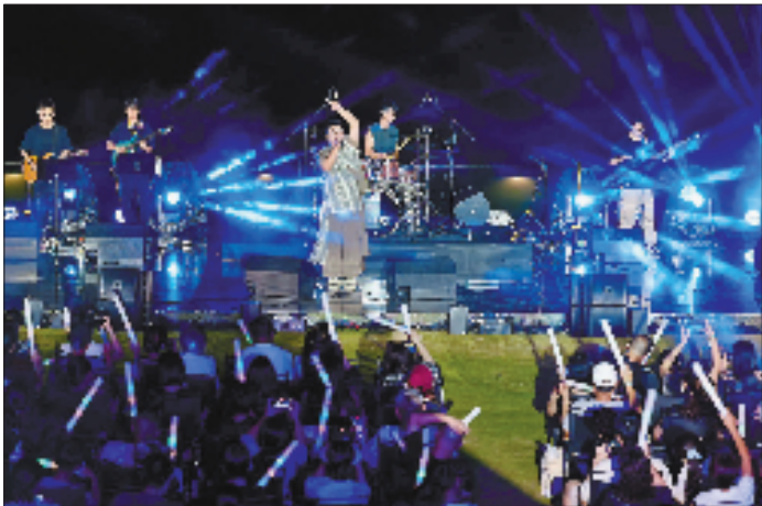
入夜,一场融合青春韵律与山海风情的海边音乐节在温岭石塘渔村浪漫呈现。