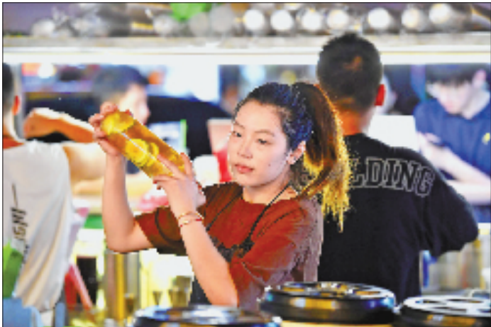
台州黄岩西范村的新前夜市弥漫着浓重的烟火味,成为当地夜间消费流量引擎。