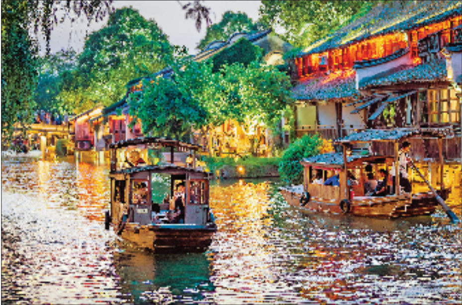
桐乡乌镇西栅景区,游客乘坐摇橹船上夜游,体验江南水乡韵味。