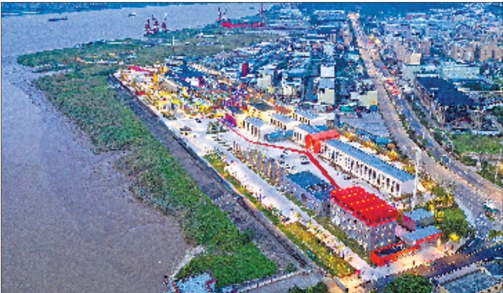
图为黄岩区台州梦创园。