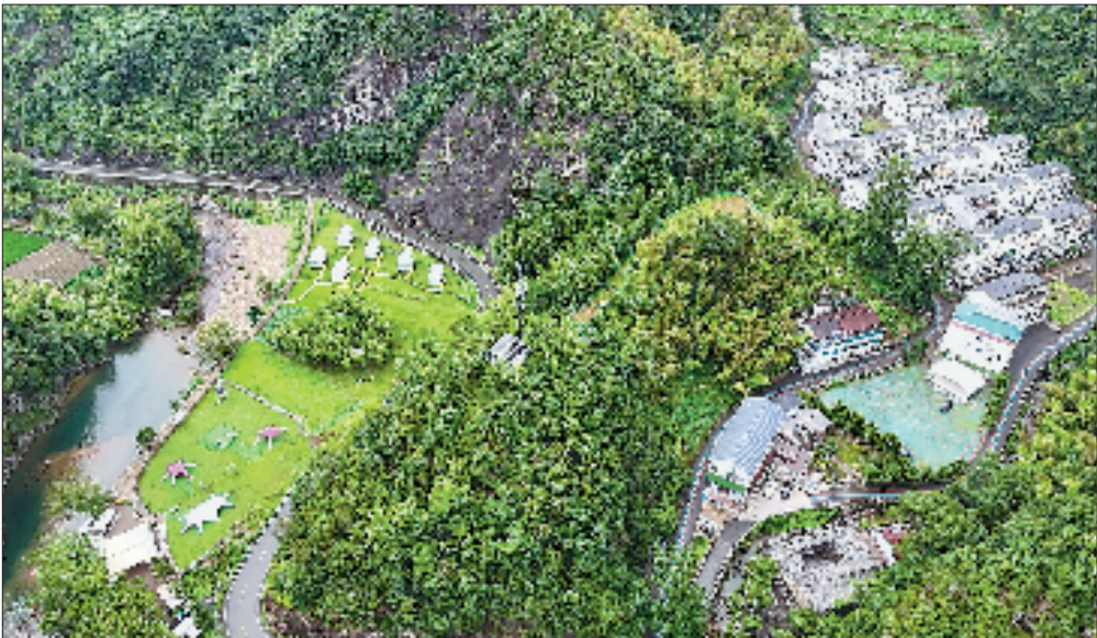
美丽的仙居淡竹乡林坑村。