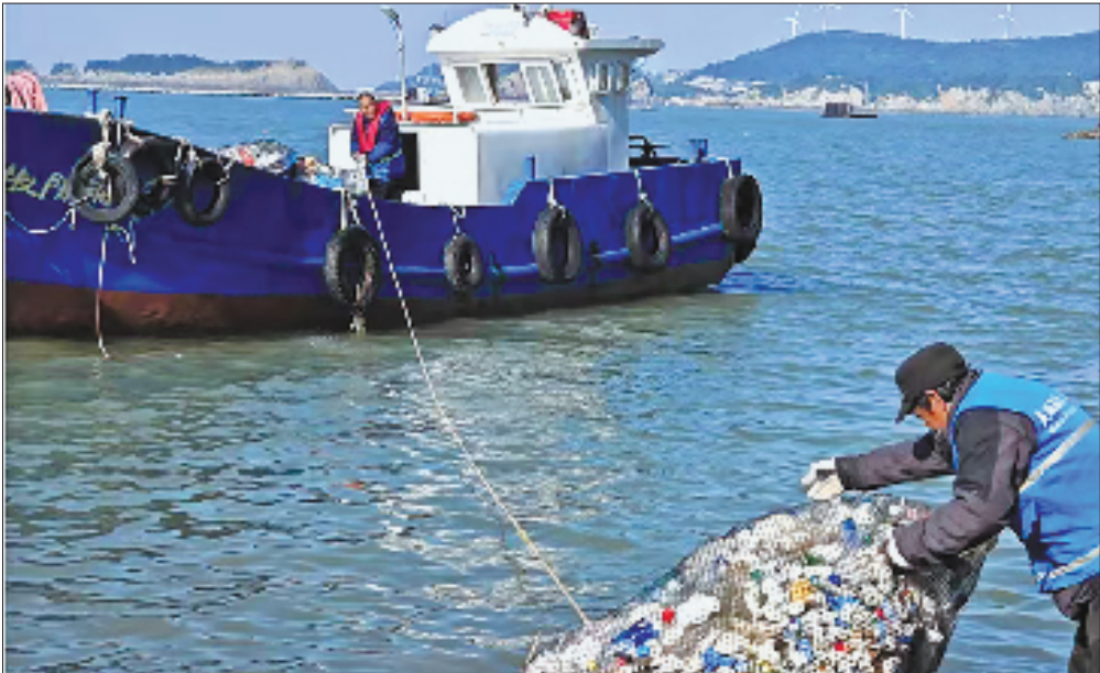
大陈岛渔民驾船出海，打捞海里的塑料垃圾。

截至7月底，“蓝色循环”模式已实现浙江5个沿海设区市25个县（市、区）全覆盖，累计收集海洋废弃物约5.88万吨，其中，废旧渔网渔具占比92.04%，减少碳排放约1.25万吨。从渔民回收到国际认证，从再生塑料到环保产品，每吨再生塑料都在创造经济价值和社会价值，真正让“垃圾变黄金”，为全球海洋治理提供“中国方案”。