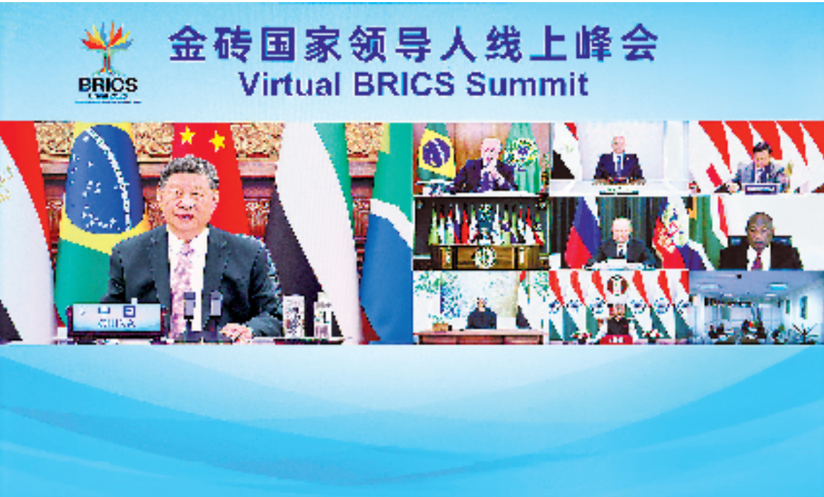
9月8日晚,国家主席习近平出席金砖国家领导人线上峰会,并发表题为《团结合作 砥砺前行》的重要讲话。

流。各国发展离不开开放合作的国际环境,谁也不能退回自我封闭的孤岛。要坚定不移推动构建开放型世界经济,在开放中分享机遇、实现共赢;维护以世界贸易组织为核心的多边贸易体制,抵制一切形式的保护主义;倡导普惠包容的经济全球化,将发展置于国际议程的