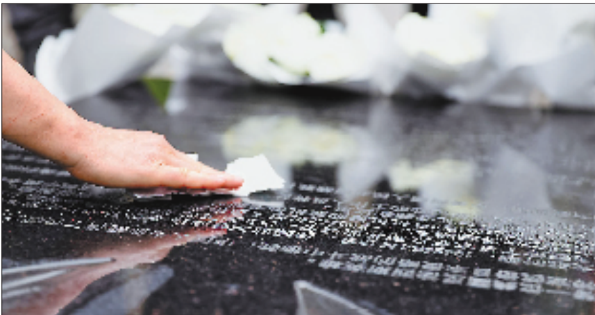
2025年4月17日,一只手轻轻拂去杜立特行动飞行员法克特铭刻碑上的灰尘。