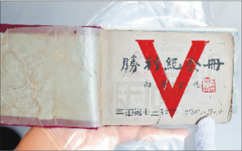
2025年9月3日,衢州杜立特行动历史研究会收藏着一本1945年9月3日的《胜利纪念册》,距今正好80年。