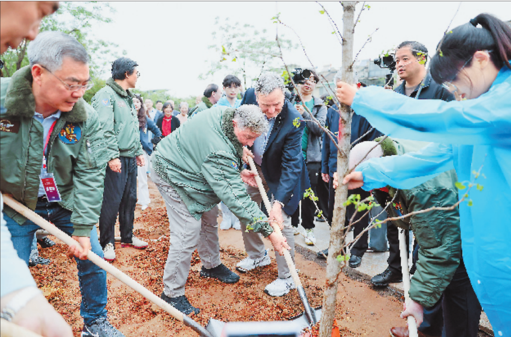
2025年4月17日,中美两国代表在杜立特行动3号机尾炮手法克特(1942年跳伞牺牲)墓碑前种下83棵树苗,象征着延续至今的友谊。