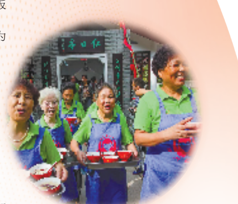
红日亭志愿者为困难群众备餐