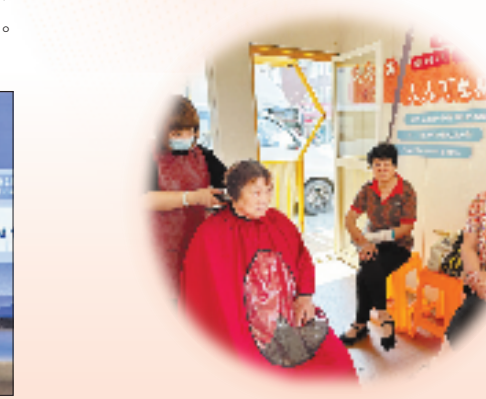
永泰村村民为老年人服务