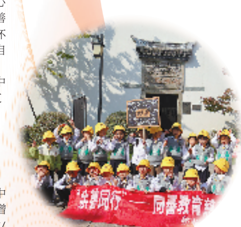
丁丙慈善基地开展研学活动