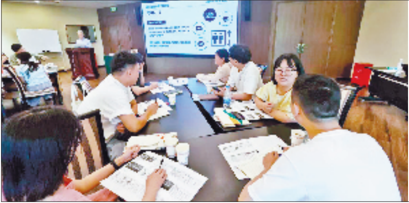
年轻干部正在进行培训

接下来,澉浦镇(南北湖风景区)将持续深耕细作年轻干部培养沃土,以“信念之火”照亮航程,以“实干之火”锻造本领,以“清廉之火”固本培元,让青春力量在时代的洪流中澎湃激荡,为海盐贡献更多的先锋力量。