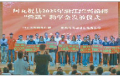
阿瓦提县2025年浙江绍兴援疆“鲁迅”助学金发放仪式

接下来,绍兴市援疆指挥部将继续聚焦受援地教育需求,深化“鲁迅教育”品牌建设,推动教育帮扶工作走深走实,为阿瓦提县培养更多优秀人才注入持久动力。