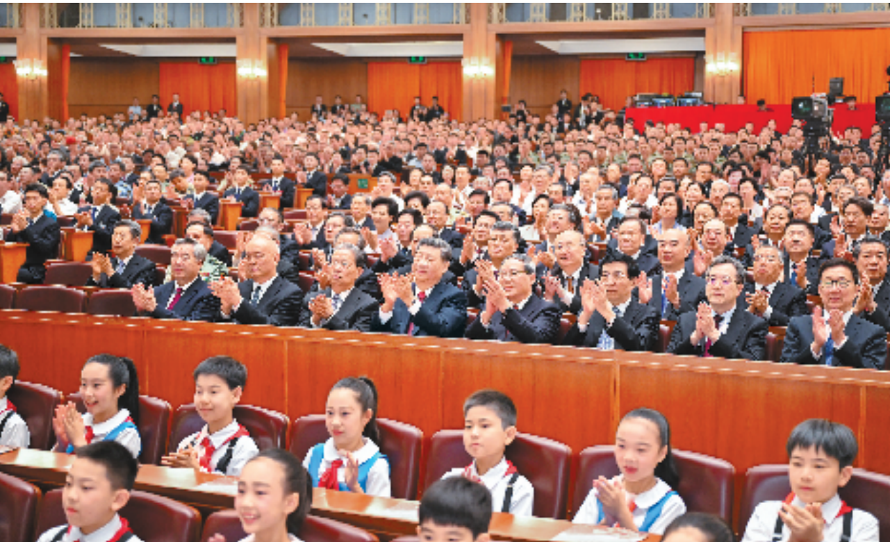
9月3日,纪念中国人民抗日战争暨世界反法西斯战争胜利80周年文艺晚会《正义必胜》在北京人民大会堂隆重举行。习近平、李强、赵乐际、王沪宁、蔡奇、丁薛祥、李希、韩正等党和国家领导人,与约6000名中外人士一起观看晚会。

新华社北京9月3日电 歌声嘹亮,唱响胜利华章;舞姿雄壮,展现正义力量。纪念中国人民抗日战争暨世界反法西斯战争胜利80周年文艺晚会《正义必胜》3日晚在北京人民大会堂隆重举行。习近平、李强、赵乐际、王沪宁、蔡奇、丁薛祥、李希、韩正等党和国家领导人,与约6000名中外人士一起观看晚会,共同纪念这个光辉的日子。人民大会堂万人大礼堂灯火辉煌,二楼跳台悬挂着“铭记历史 缅怀先烈 珍爱和平 开创未来”的横幅。舞台正中,“正义必胜”4个金色大字熠熠生辉,庄严雄伟的长城造型象征着中华民族不屈的精神脊梁。晚会开始前,少先队员向前来观看演出的抗战老战士老同志代表献花。随后,老战士老同志们 in 少先队员的簇拥下,来到大礼堂观众席就座,全场起立报以热烈掌声,向他们致以崇高敬意。19时55分许,欢快的迎宾曲响起,习近平等领导同志步入大礼堂,同抗战老战士老同志代表亲切握手。在8声庄严肃穆的钟声中,音诗画《山河铭记》拉开整场晚会的序幕。第一场“怒吼吧,黄河”中,情境表演《中华民族到了最危险的时候》、情境