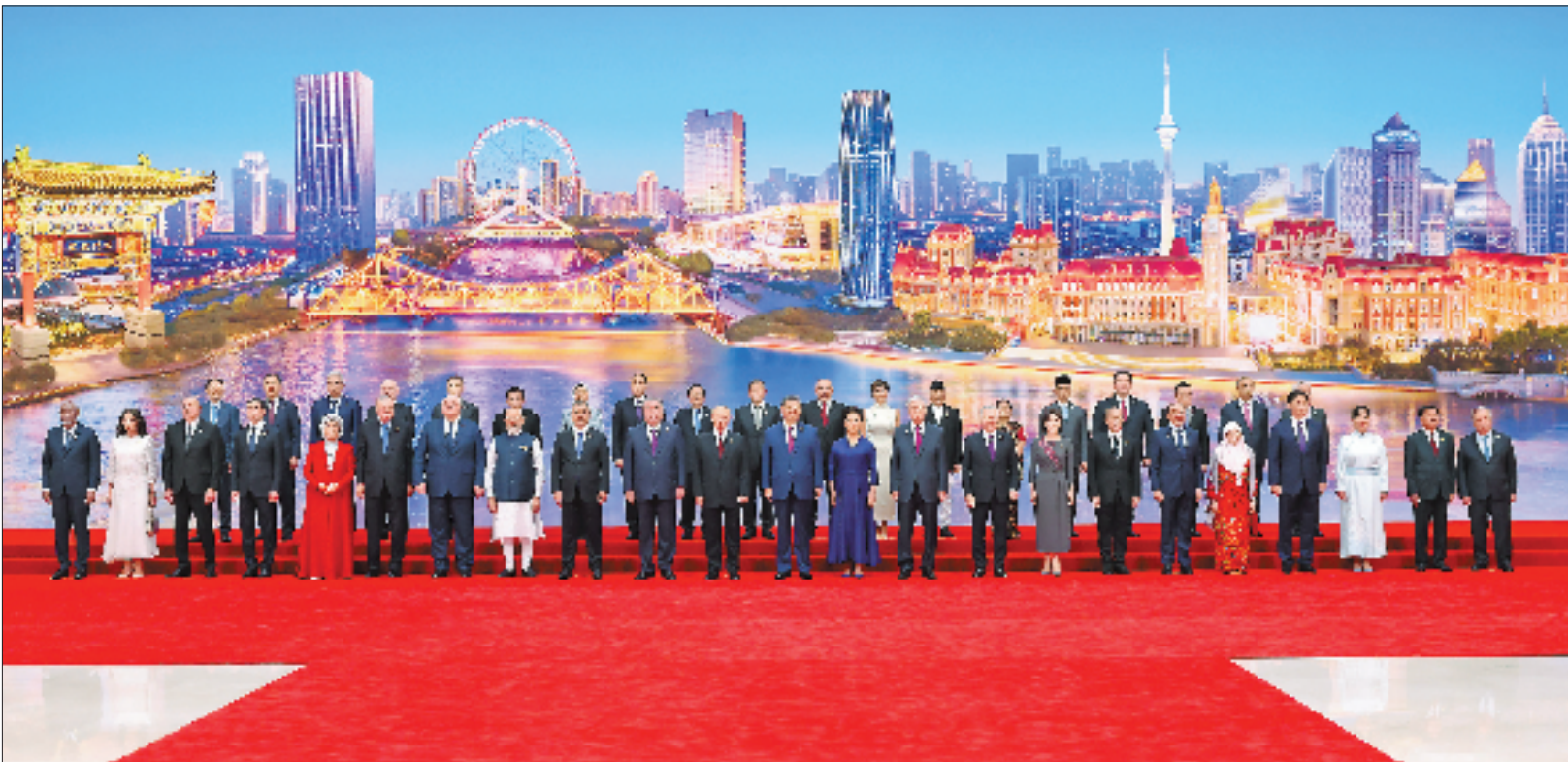
8月31日晚,国家主席习近平和夫人彭丽媛在天津梅江会展中心举行宴会,欢迎来华出席2025年上海合作组织峰会的国际贵宾。这是宴会前,习近平和彭丽媛同贵宾们集体合影留念。

新华社天津8月31日电 (记者马卓言 李鲲)8月31日晚,国家主席习近平和夫人彭丽媛在天津梅江会展中心举行宴会,欢迎来华出席2025年上海合作组织峰会的国际贵宾。海河之畔,灯光璀璨。出席峰会的上海合作组织成员国、观察员国、对话伙伴国、主席国客人等20多位外国国家元首、政府首脑