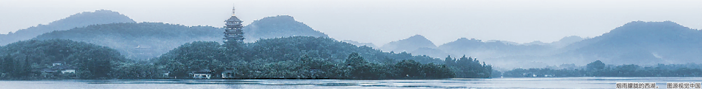
烟雨朦胧的西湖。

清代,从涌金门到钱塘门的湖滨地区建有旗营,是一座城中城,东南角水流弯曲,平沙浅草,原有黑亭子,又名亭子湾。“亭湾水浅波光连,沙草平坦校场宽。”浙江总督李卫重建射亭,名聚贤亭,供八旗子弟骑射练武。乾隆南巡来杭,时常在这里阅兵,所以有“亭湾骑