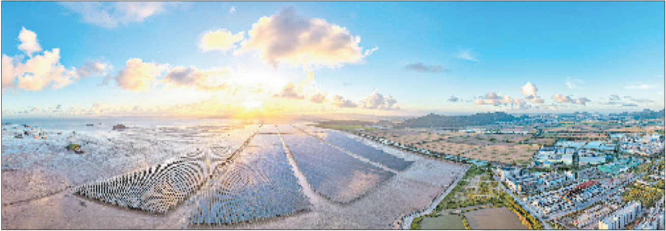
温岭松门渔光互补光伏电站