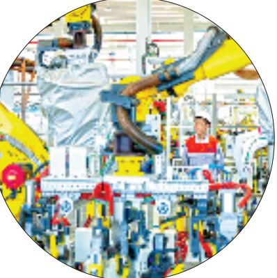
长兴经济技术开发区内,科技创新提升汽车部件产品附加值与生产效率。

钱塘潮起,千帆竞发;之江大地,创新潮涌。协商会上,大家为加快创新浙江建设集众智、谋良策、聚共识,共同书写中国式现代化更精彩的浙江篇章。