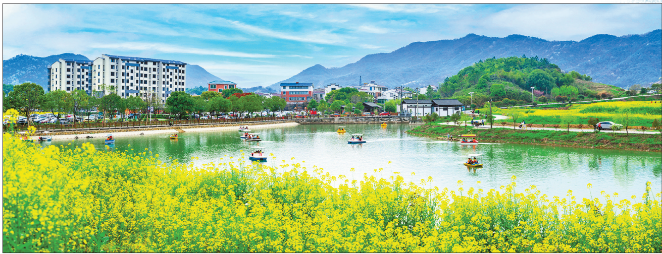
义乌市后宅街道李祖国际创客村