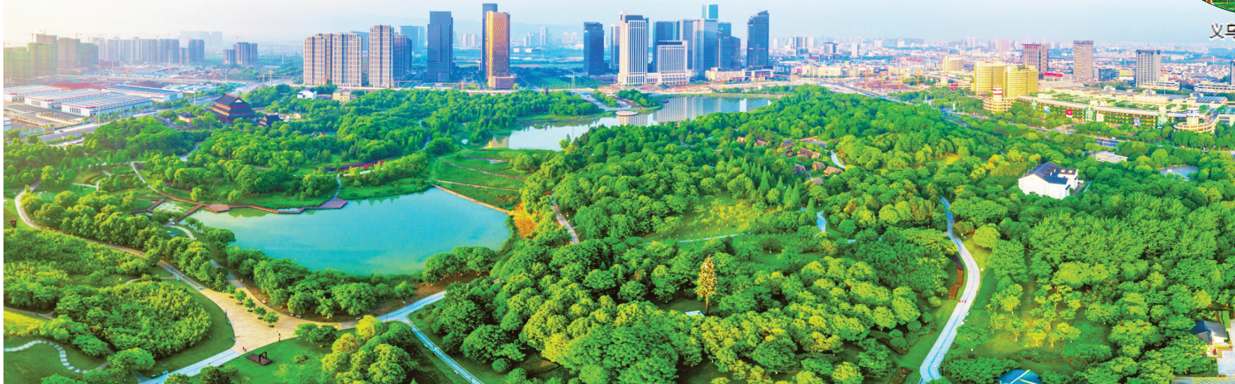
义乌市福田湿地公园