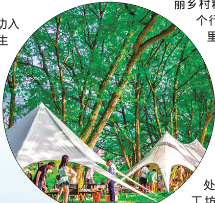
义乌市佛堂镇钟村