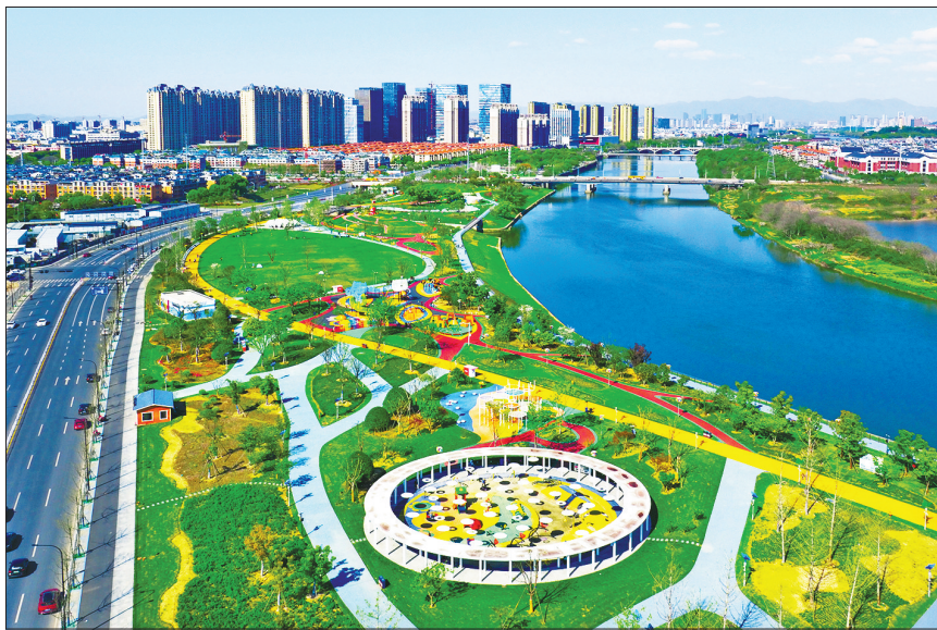
义乌儿童公园鸟瞰

义乌全市大量生活垃圾、污泥和餐厨垃圾。垃圾焚烧产生的热能转化为每年4亿度电和220万吨工业蒸汽，园区废气排放达到欧盟标准。这个花园式工厂有效处理城市废弃物，2024年产值达35亿元，是 低碳循环型 转化的典型范例。园区提供2000多个就业岗位，每年为周边村民带来工资性收入超亿元，实现了绿色成果共享。