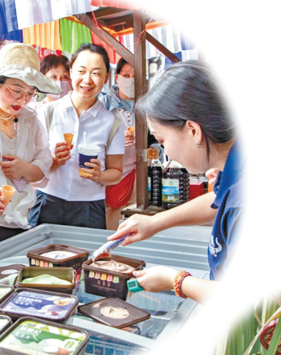
8月22日,婺必有V人民广场音乐季活动现场,来自四川道孚县的牦牛奶冰淇淋深受市民喜爱。

近年来,婺城区积极把握发展机遇,以民宿撬动乡村旅游产业,持续深化民宿+模式,构建多层次、多元化的特色民宿体系,为乡村振兴注入强劲动力。散落于各乡镇的特色民宿,犹如一串镶嵌在青山绿水间的珍珠,有的古意盎然,有的质朴天然,有的精巧别致。花石相映,山水成趣,传统与现代在此和谐共生。