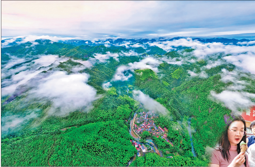
南山省级自然保护区