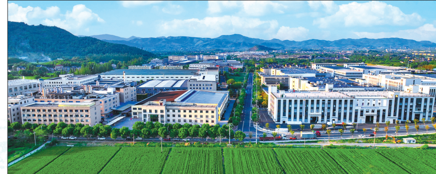
径山镇龙皇塘工业区

推进科技创新和产业创新深度融合，推动企业绿色发展，径山的山坳里正长出“新质生产力”。