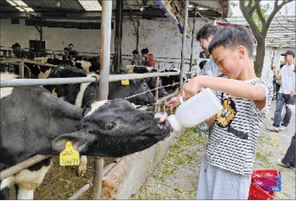
游客在嘉兴市秀洲区的东兴奶牛场喂奶牛。