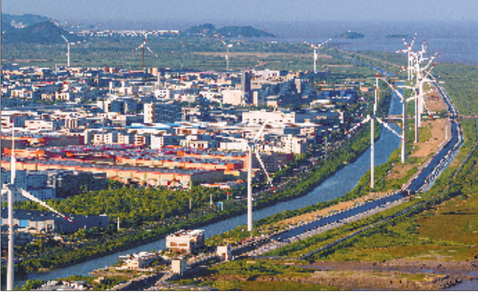
海宁市黄湾镇江滩上一座座白色的大风车。

矿坑废墟蝶变为山水画卷,是海盐坚定生态治理的缩影。海盐县持续开展乡村风貌品质提升行动,同步推进农房改造、管线序化和村道提升。目前,海盐已成功创建省级未来乡村12个、3A级景区村庄14个。