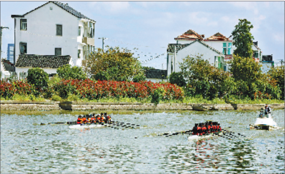
平湖市马厰村赛艇小镇举行青少年赛艇邀请赛。