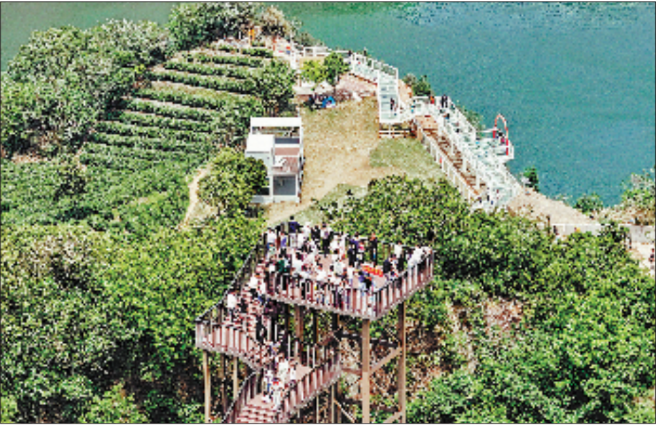
游客在海盐县丰义村的矿坑月湖参观。