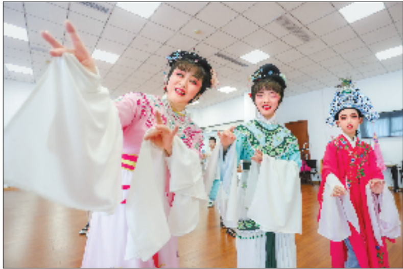
8月13日,长兴县画溪街道党群服务中心内,“小候鸟”们在戏曲老师的指导下体验越剧文化课程,感受戏曲魅力。

湘家荡旅游度假区还携手区域内商家、文旅企业,成立旅游联盟,充分整合各方资源,促进共建共享,凝聚成一股推动度假区进步的强大合力。通过联盟的协调与合作,各主体之间实现了信息互通、客源互送、活动联动。