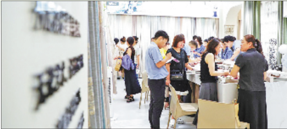
展会现场人来人往，热闹非凡。

从智能生产线的高效运转到节能改造的绿色实践，从材料革新的技术突破到全产业链的协同升级，许村家纺的每一步探索，都在累积中促成蜕变，清晰勾勒出传统产业在科技浪潮中破局前行的轨迹。