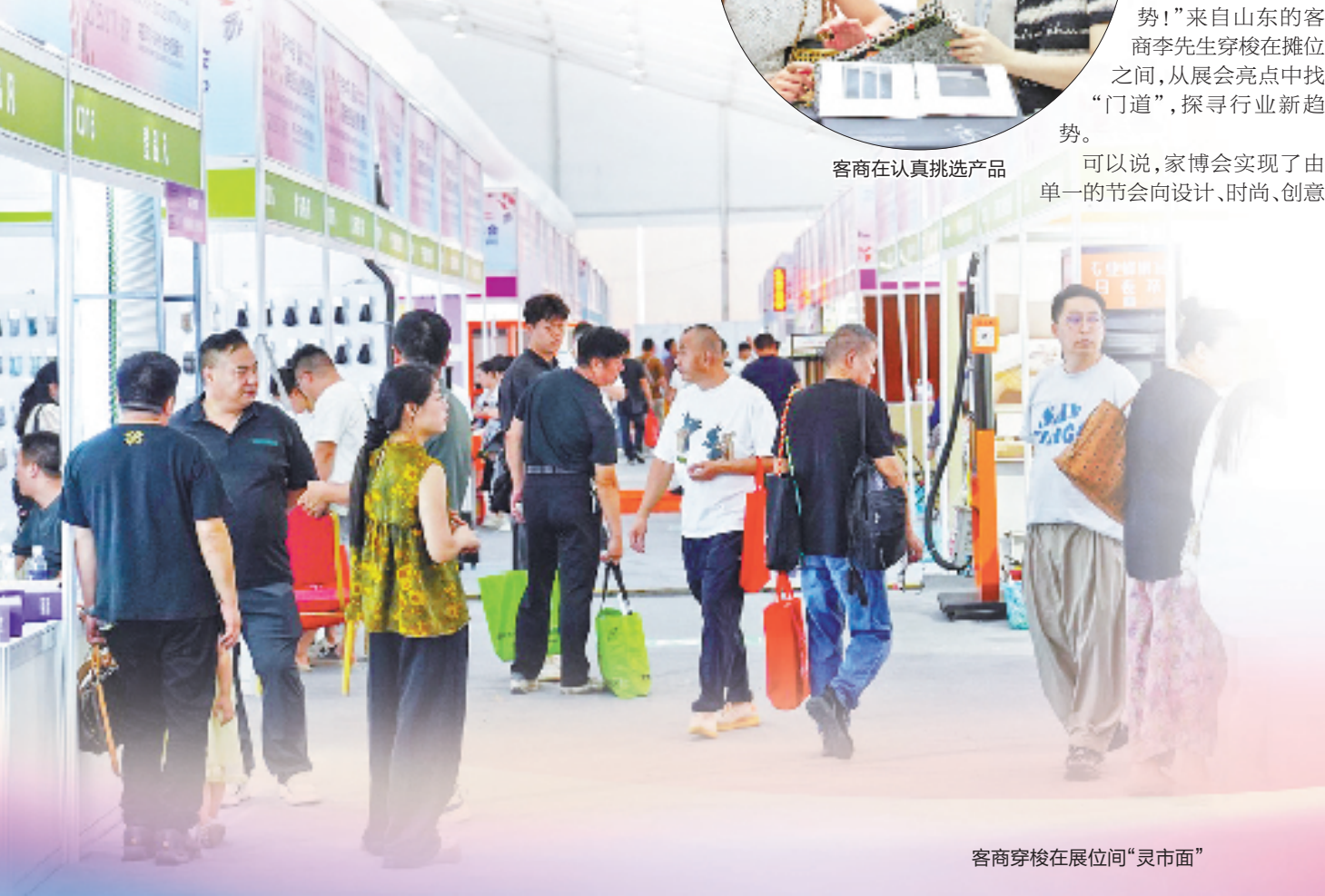
客商穿梭在展位间“灵市面”