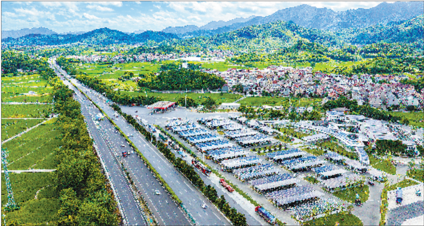
图为G25长深高速（杭千高速）杭州桐庐服务区(南区)光储充一体化智慧充电站。

记者采访发现，各地博物馆的主题展览也组成了一场沉浸式的红色之旅。浙江省博物馆推出用棕刷墨印体验、制作有声明信片