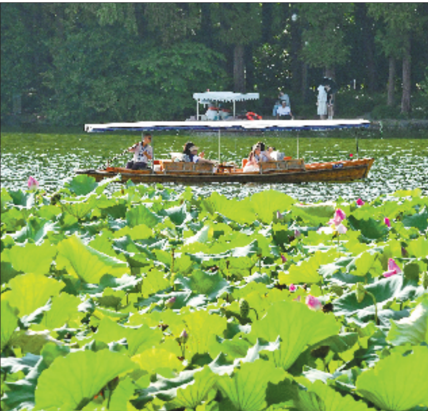
8月17日，游客坐船游览西湖。