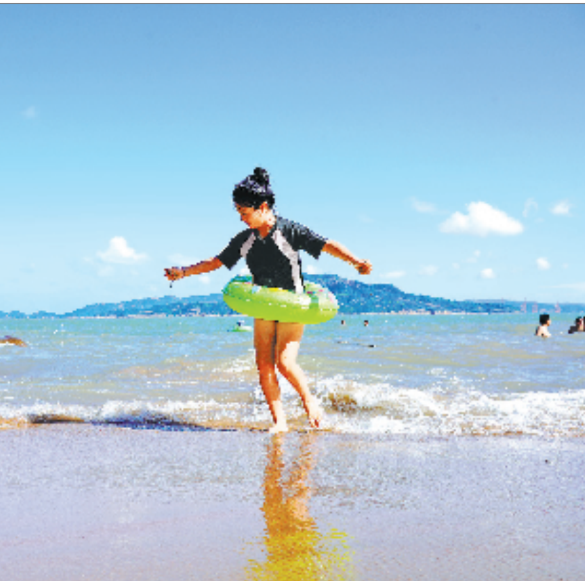
8月17日，小朋友在温州市洞头区大门海岛沙滩戏水。