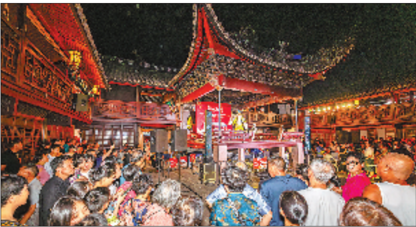
8月17日晚，2025年宁海县夏季文旅消费活动拉开序幕。本次活动以“城隍庙古戏台”为核心舞台，串联起非遗体验、夜市烟火与宋韵美学，游客不仅可近距离观摩金彩漆等非遗技艺，还可欣赏当地传统戏曲表演。 通讯员 章莉 童俊霖 本报记者 陈醉 文/摄

研讨会汇聚了热衷公益事业的企业家和社会各界人士560余人，围绕驱动科技创新、助力企业发展座谈研讨，不仅为社会各界搭建了交流与合作的平台，更凝聚起推动公益事业发展与经济繁荣的合力，为民营企业在时代浪潮中稳健发展注入精神动力、探索实践路径。