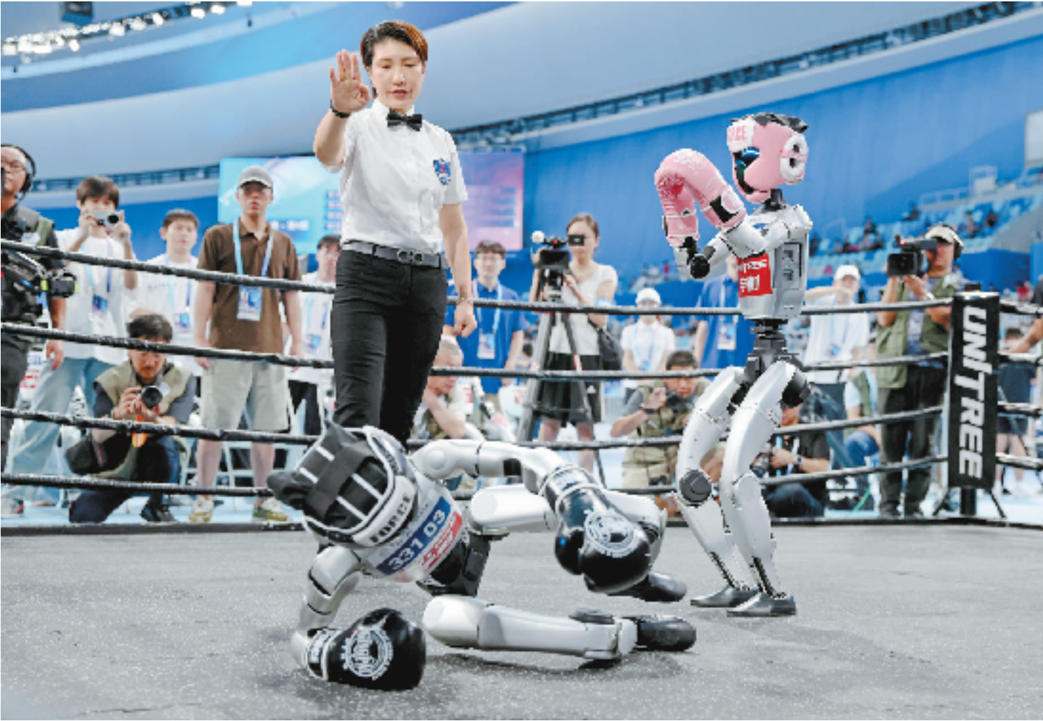
自由搏击项目中,人形机器人G1被击倒后起身再战。