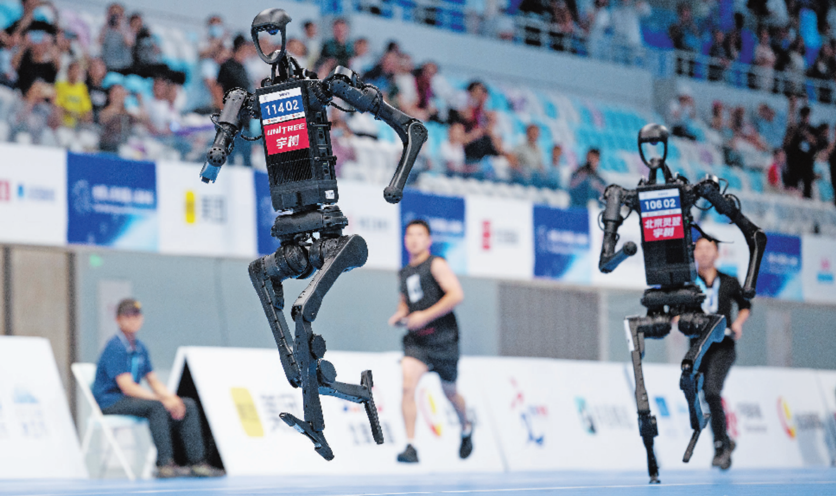
田径400米的赛场上,宇树H1机器人步伐轻快,一骑绝尘。

在全球目光的聚焦下,人形机器人的尽情“炫技”与“花活”展示,更大规模集结了从核心零部件商、整机制造巨头到地方创新中心的全产业链力量,一场由中国发起的科技盛会,正在掀起新一轮的技术和产业浪潮。