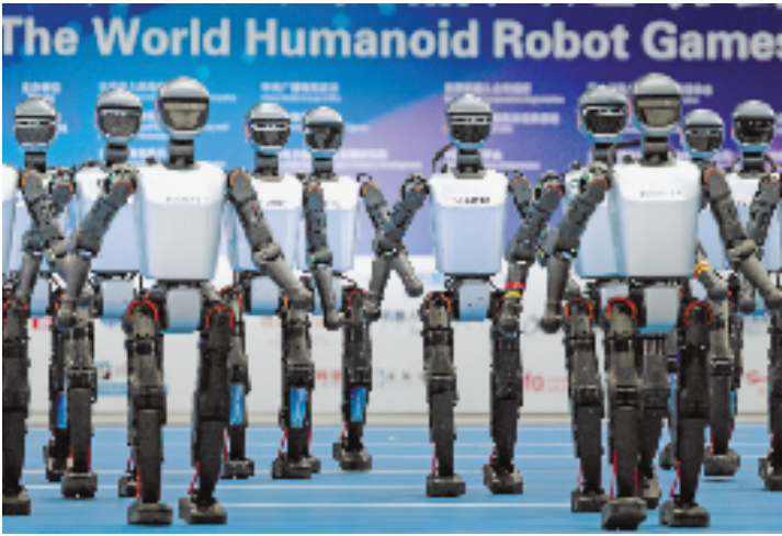
国产人形机器人Booster组成方阵走上开幕式舞台,未来感扑面而来。