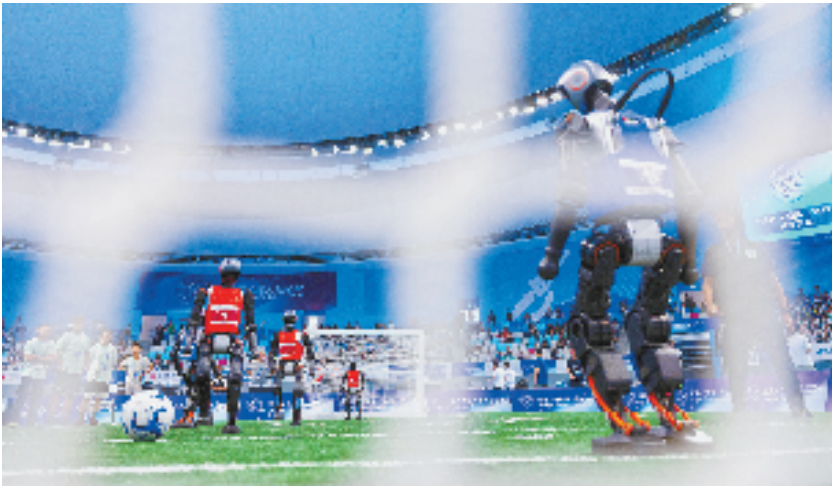
5V5足球项目中,机器人门将面对持球单刀突进的机器人运动员。