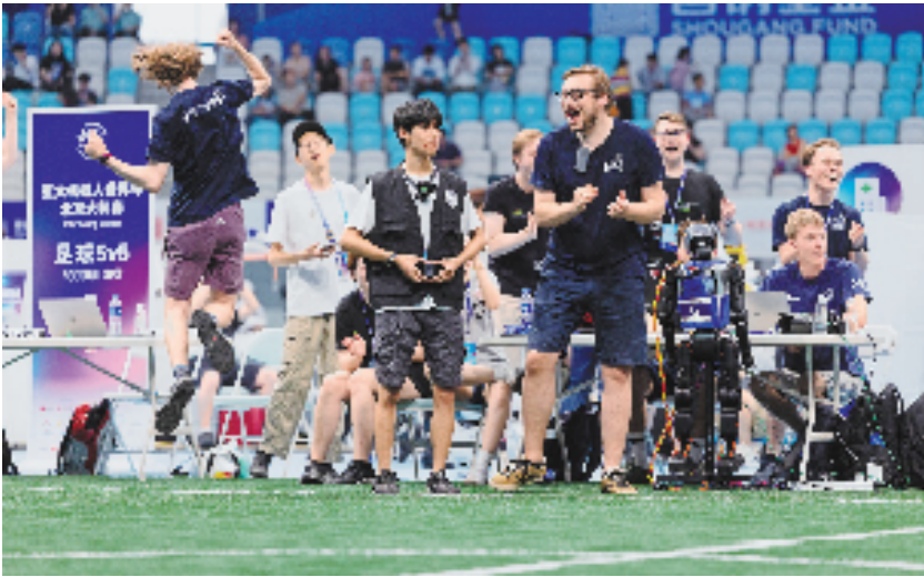
赢得一场机器人足球赛后,来自德国的HTWK战队成员兴奋庆祝。