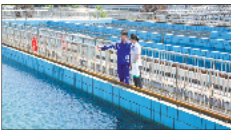
农行浙江省分行工作人员走访了解企业污水处理设施运行情况。