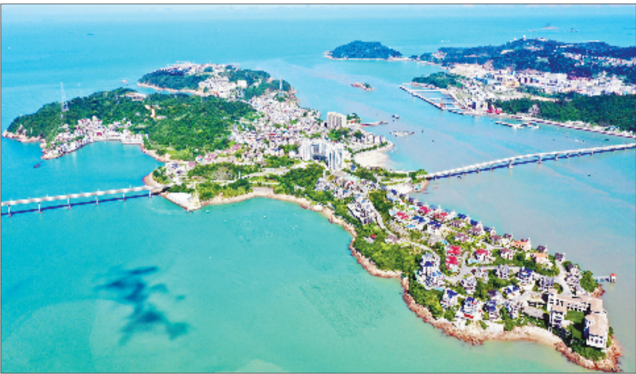
农行浙江省分行金融助力温州洞头“海上花园”建设，支持海洋生态保护修复等环境治理和提升工程。