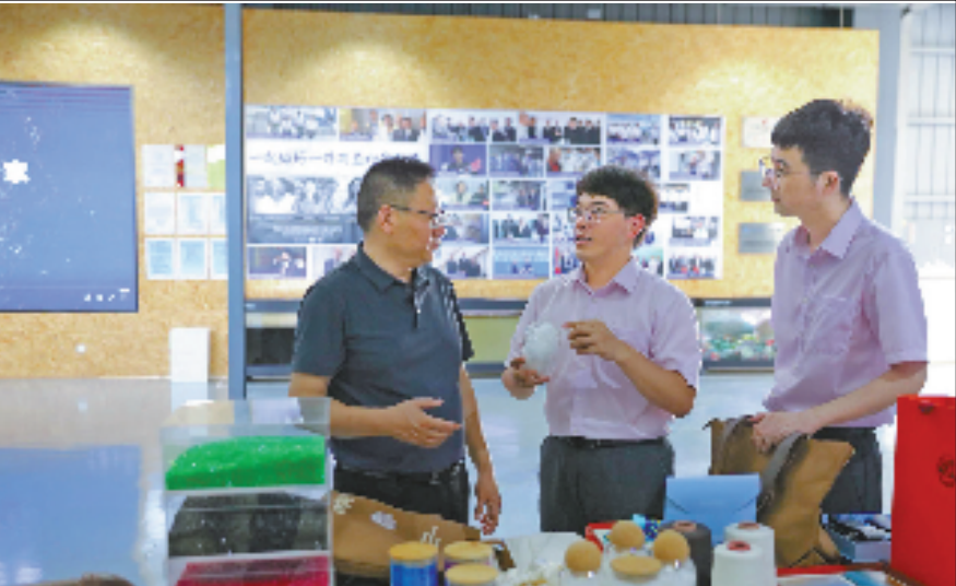
农行浙江省分行工作人员走访企业，了解海洋塑料粒子生成的纱线。