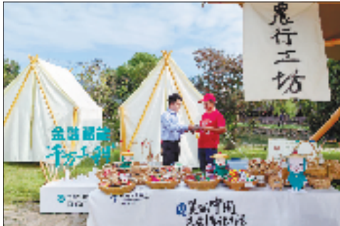
农行浙江省分行工作人员在温州永嘉县丽水街古村开展“共富市集”活动。