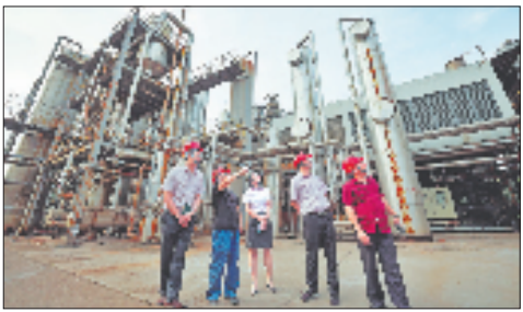
农行浙江省分行服务团队为衢州一家双氧水生产企业发放全国首笔“工业减碳贷”。