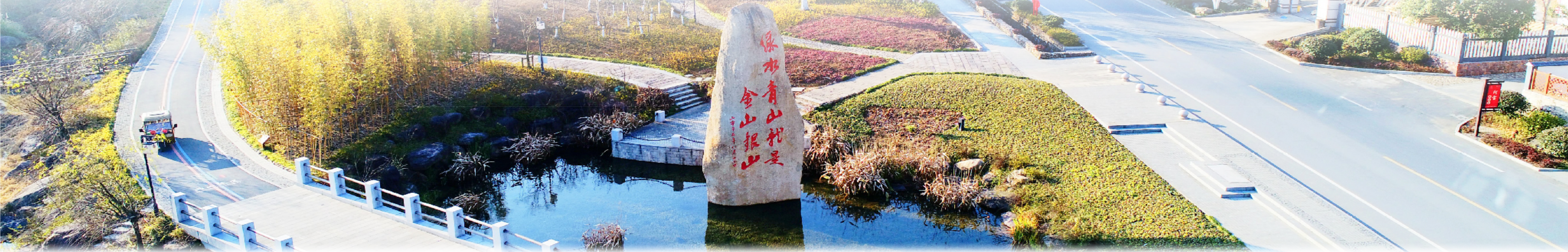
农行浙江省分行为湖州安吉余村发放“乡村旅游重点村贷款”，助力打通“两山”转化通道。

二十年前，一颗种子在湖州安吉余村的翠色山峦间破土，孕育出绿水青山就是金山银山理念。二十年山水之约，农行浙江省分行以金融为笔，以绿意为题，在之江大地上挥毫一幅“点绿成金”的美丽画卷。