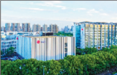
宁波联通5G创新中心大楼(图左)

在全市100余家营业厅内设置“爱心驿站”，为户外工作者提供一个个“累了可歇脚、渴了可喝水”的休息站；在全市建立起56家“中国联通智慧助老服务体验中心”，以常态化“银龄专享”服务为老年人带去智能手机使用、热门APP应用、反诈知识等公益课堂；为视障、听障人群推出专属的通信产品，定期开展残疾人关怀、慰问活动，让数字科技之花充分惠及他们。宁波联通组建了“橙心”志愿者队伍，在城市角落或乡村阡陌，联通志愿者关怀备至的为民服务，彰显着邻里更和睦、社区更和谐、城市更美好的幸福图景。以服务人民为己任，早已深深印入每位宁波联通员工的血脉中。