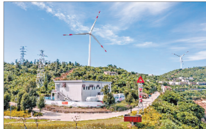
大陈岛低频风机迎风转动

这便是全省首创的天台“逐地牧光”示范项目，通过将固定式的光伏设备改造成灵活移动的光伏模块，为盘活闲置土地资源开辟了清洁化利用新路径，巧妙破解了储备用地临时利用时间不确定的难题。这是国网台州供电公司探索绿电应用的创新实践。作为浙江“七山一水二分田”的缩