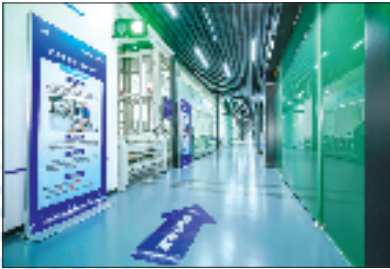
宁波联通为双鹿电池打造的黑灯工厂

近年来，宁波深入实施“八八战略”，不断促进实体经济和数字经济深度融合，进一步推进创新浙江建设。宁波联通助力宁波制造业领域全面推行智能化改造，以工业互联网重构生产流程，为雅戈尔打造“未来工厂”，使得一件成衣的反应速度从15天缩减到5天，流水线生产效率提高25%；为双鹿电池量身定制5G工厂，两台机械臂、一台AI质检仪，仅需2秒就可完成625颗电池的“体检”，准确率提升到98%……自2019年下半年中国联通全面承接宁波市“5G+工业互联网”8+1+1试点工作以来，宁波联通已成功实施龙头企业