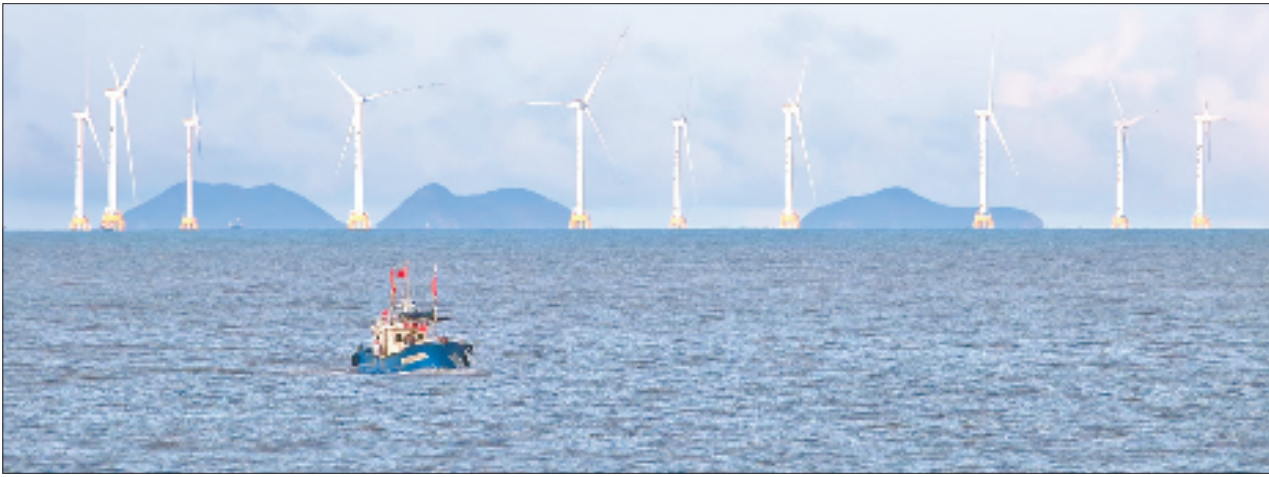
玉环1号海上风电场风机