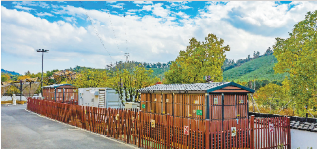
国网湖州供电公司集中炒茶点定制移动式储能装置，满足当地茶农电炒茶短时大负荷用电需求。

更多路径、更好模式、更新场景正在浙江各地开启。青山常在，绿水长流，空气长新，这幅美丽的现实画卷正从浙江向全国徐徐铺开。无数个“余村”正向着人与自然和谐共生的中国式现代化目标加速前进。