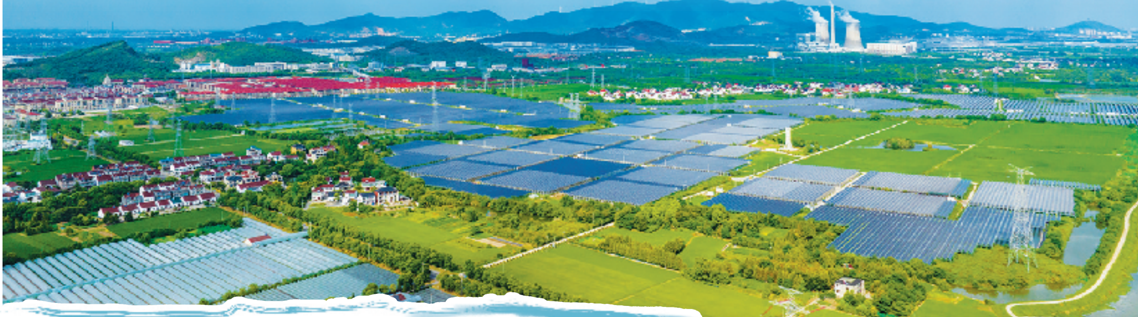
长兴雁陶村光伏项目

如今，绿色已然成为浙江发展最动人的底色。在能源领域，国网浙江电力积极践行绿水青山就是金山银山理念，坚持向“绿”谋变、向“新”而行，驱动社会生产生活的绿色低碳转型，助力绿水青山就是金山银山从理念转化为行动，从愿景转变为现实，为浙江高质量可持续发展注入动能。