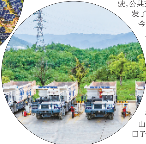
矿区纯电动无人矿卡充电桩