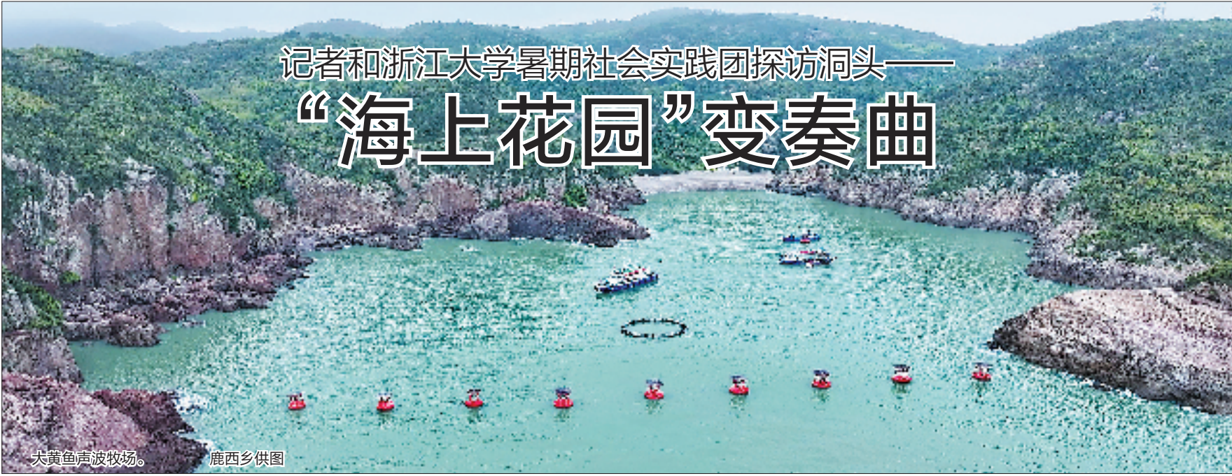
大黄色声波牧场。

渔业加快现代化转型是洞头发展海洋经济的一个缩影。调研中,我们还一同前往代理海洋特色医药产品的浙江德宁医药有限公司、为海洋风力发电等生产高端储能装备的温州祥运新能源有限公司等地。令我们惊喜的是,全省海洋生物制药第一家上市企业、全国首个面