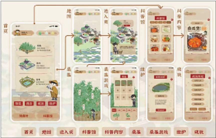
“农遗新生”团队设计的蚕桑主题游戏。

间。”经过调研,团队最终定下“轻量化”的设计方向——无需另外建设实景装置,仅需小体量的纸质道具,就能让游客在解谜探索中深度体验古村的建筑美学、农遗底蕴与人文故事,既避免了过度开发和维护负担,又创造出“可玩、可学、可传播”的微解谜模式。