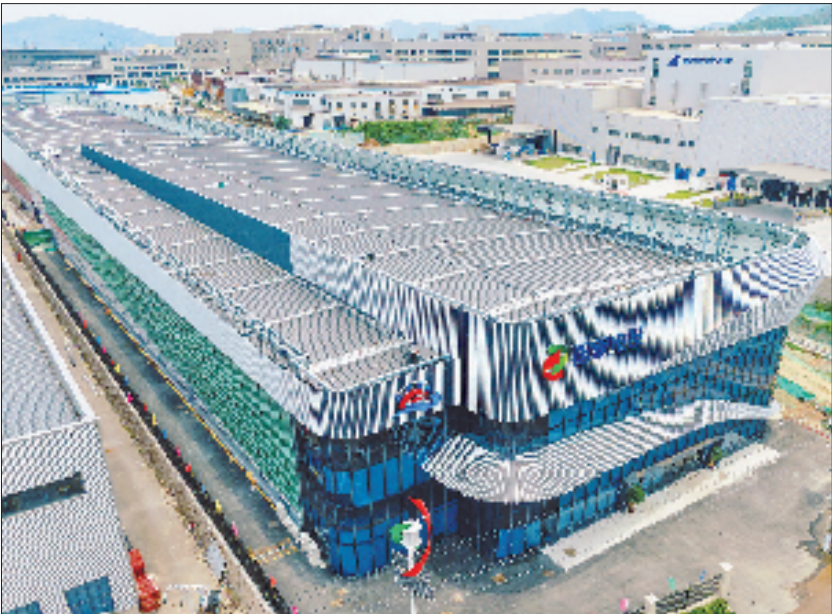
中行浙江省分行为长兴综合智慧零碳电厂“和平共储”项目提供金融支持。