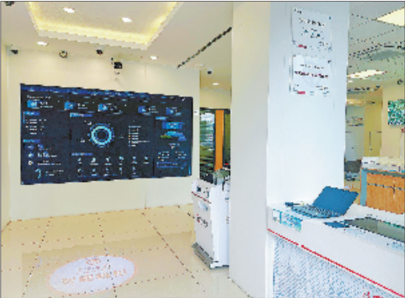
湖州地区首家“碳中和”三星级网点中行安吉昌硕支行。

“面向新兴领域、面向未来、面向高质量发展”是新质生产力的要义。中行浙江省分行联动集团内中银金融资产投资有限公司为正泰安能、极氪工厂、福瑞泰克、孔辉汽车等绿色产业客户叙做股权投资业务,助力企业充实股权资本。