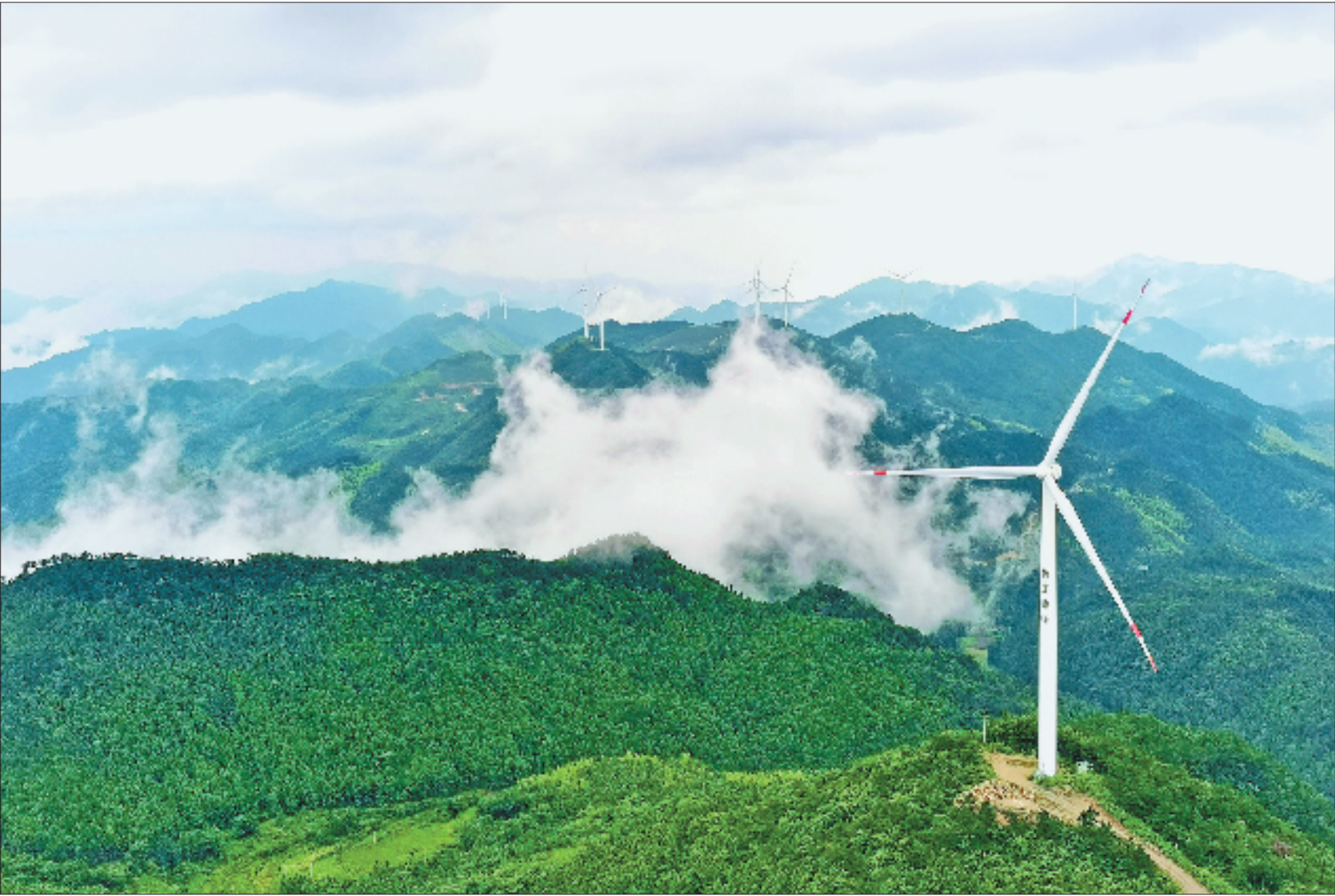
中国银行磐安县支行支持的浙江鼎峰风力发电项目。