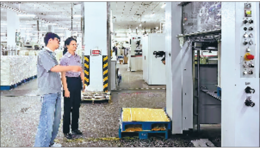
中行员工走访企业,向企业介绍绿色金融产品。

在全球能源转型加速推进的背景下,海上风电作为可再生能源发展的重要领域,正加速释放蓝色经济新动能。近年来,中行浙江省分行紧跟浙江省海洋清洁能源的开发步伐,总分支机构密切联动、高效响应,为各大能源集团在舟山、台州、温州等地的海上风电项目提供项目融资支持。