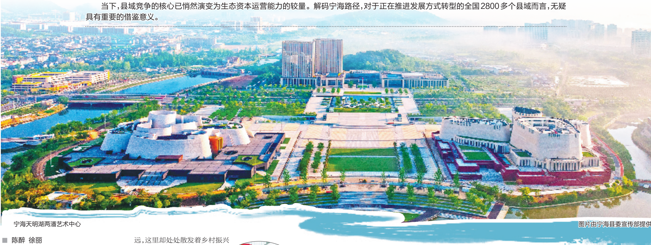
宁海天明湖两潘艺术中心

尽管烈日炎炎,在宁波市宁海县桥头胡街道双林村感受到的却是心静自然凉。溯溪而上,眼前是扑面而来的郁郁葱葱,耳畔是潺潺不绝的溪水叮咚…… 如此“原汁原味”的绿水青山,使得宁海成为全省第二个生态“大满贯”的县域:“全国生态示范区”“国家生态县”“国家生态文明建设示范区”、绿水青山就是金山银山实践创新基地……去年,宁海还跃升为全国绿水青山就是金山银山发展百强县第一位。 今年是绿水青山就是金山银山理念提出20年。20年来,宁海并未止步于“治山理水”,而是大胆探索绿色导向机制,将生态资源升华为可量化、可交易、可增值的战略资本。当地通过驱动“生态产业化、产业生态化”,将绿水青山就是金山银山理念深度融入新型县域经济发展的血脉,以“山水林田湖”为棋盘,重新定义县域经济的内涵。 当下,县域竞争的核心已悄然演变为生态资本运营能力的较量。解码宁海路径,对于正在推进发展方式转型的全国2800多个县域而言,无疑具有重要的借鉴意义。