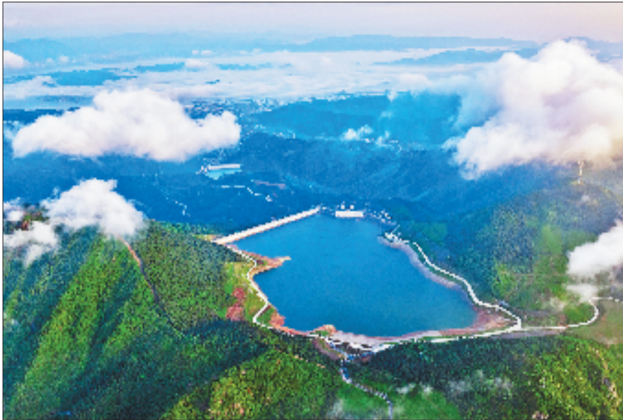
宁海抽水蓄能电站