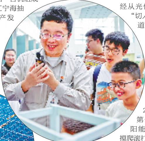
宁海生态文明教育基地面向公众开放