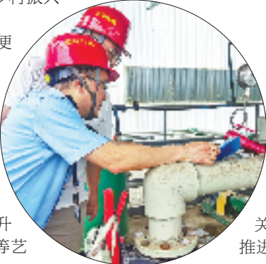
环境执法人员入企帮扶

像这样,宁海借力专家智库力量,在环评报告评审过程中,对企业生产中使用的原辅材料、生产工艺、末端治理及安全生产等方面提出“降本增效”管理建议。这一全省首创“评审增值”服务,扩大“多评合一、打捆环评”改革成效,创新“容缺受理、并行审查”工作机制,27个“千项万