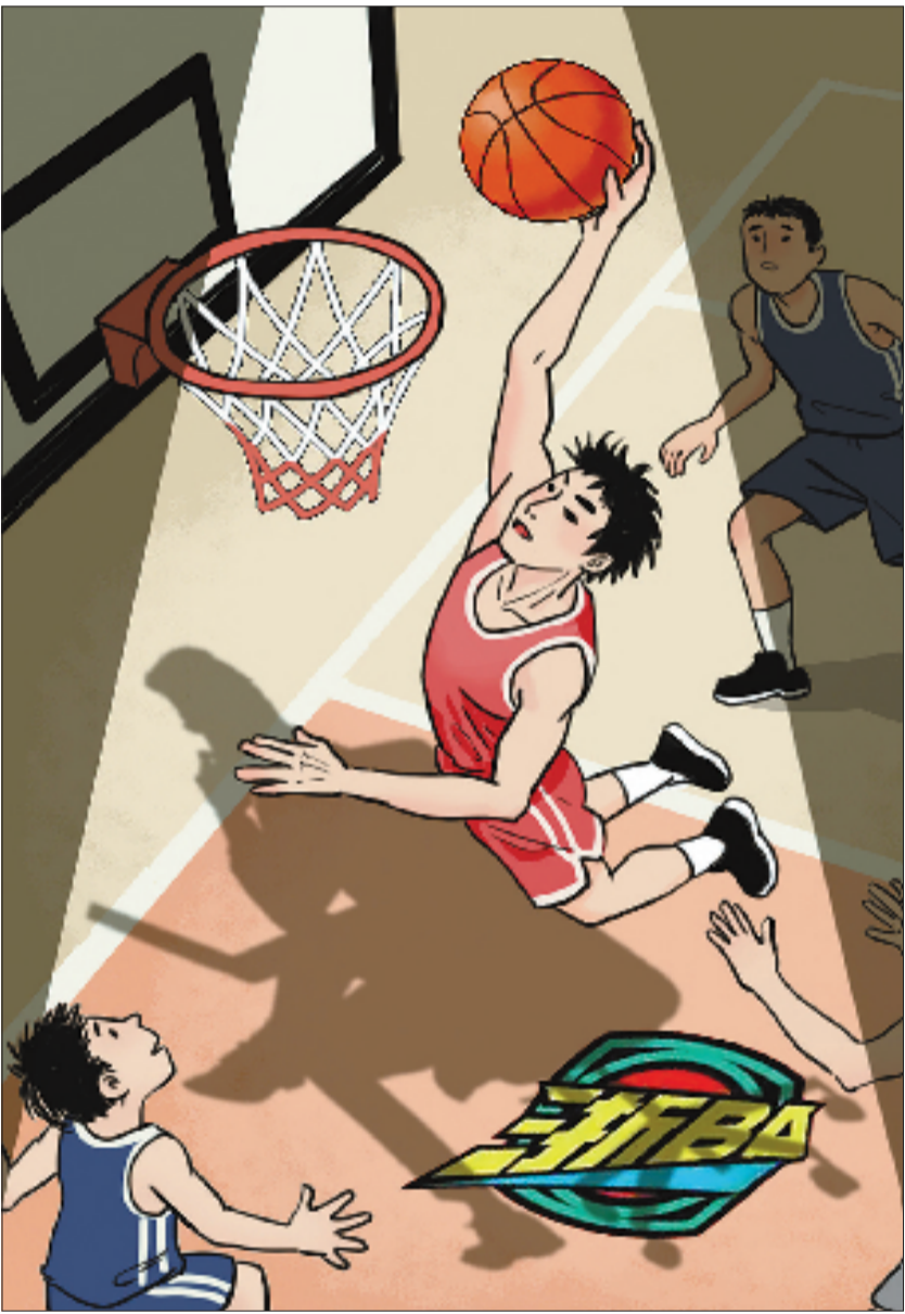
白天,他们身着笔挺西装,在商海中运筹帷幄;夜晚,他们换上战袍球鞋,在赛场上挥洒汗水。“白天当老板,晚上抢篮板”的生活模式,正成为浙江多地企业家的新风尚。他们也成了浙BA以及城市精神气质的代言者,成为赛场内外一道独特的风景线。 陈昱志 金妍 作