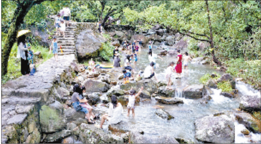
盛夏骄阳下,温岭市温峒镇白岩下村溪流潺潺,众多游客在嬉水纳凉。

20年来,浙江人民始终遵循“绿水青山就是金山银山”理念,持续整治环境污染、不断提升生态优势、接续培育生态文化,一幅绿水青山、如诗如画的美丽画卷徐徐展开。前不久,全国首个