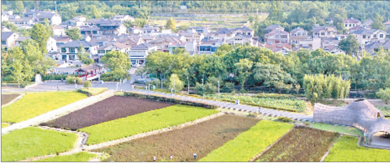
湖州市安吉县天荒坪镇余村,竹海掩映下,曲径通幽的村落和绿色田园相映生辉,构成了一幅人与自然和谐共生的美丽画卷。

会发言建议,坚持以数字政府2.0赋能提升污染治理监管水平,健全“天空地海”监测监控网络,综合运用AI模型、卫星遥感等监管手段,提升精准发现问题和高效闭环处置能力,构建整体智治、高效协同的生态环境数字化监管模式。