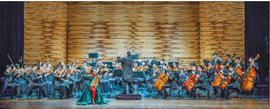
宁波交响乐团赴美国巡演。