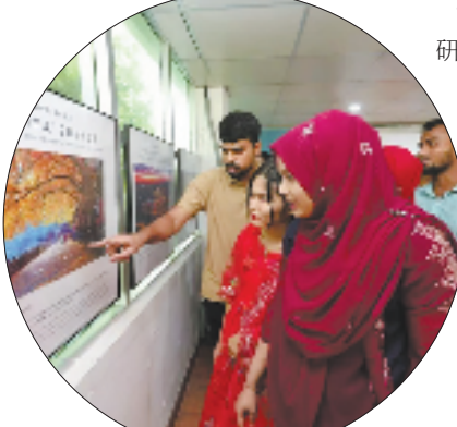
百企百展走进康大美术馆