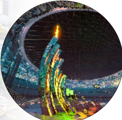
杭州亚运会开幕式主火炬

一座城市的真正竞争力，既在于经济硬实力，更在于精神软实力。在当下复杂严峻的国际环境下，“精神富有”正是宁波抵御外部风浪、应对内部挑战的强大内在力量，这也是“文化强市”的基底。