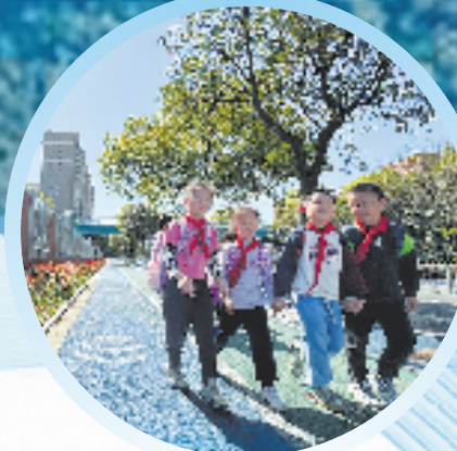
宁波打造“最美上学路”。