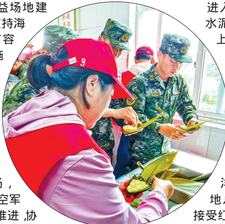
端午节进军营活动。

正值暑假研学游高峰,这段时间,西洋湾坑道国防教育阵地总是围满了慕名前来接受红色文化洗礼的当地中小学生及家长。嵊山解放战争后守岛部队在此值勤放哨、侦查巡逻、坚守海疆的旧址,西洋湾坑道国防教育阵地的作战会议室还摆设着当年的各种设施和枪弹等作战武器及装备。嵊山镇投入30多万元将其改造为沉浸式国防教育基地,推出 海防体验游 公益研学路线,军事文化的融入有效提升了西洋湾景区的品质