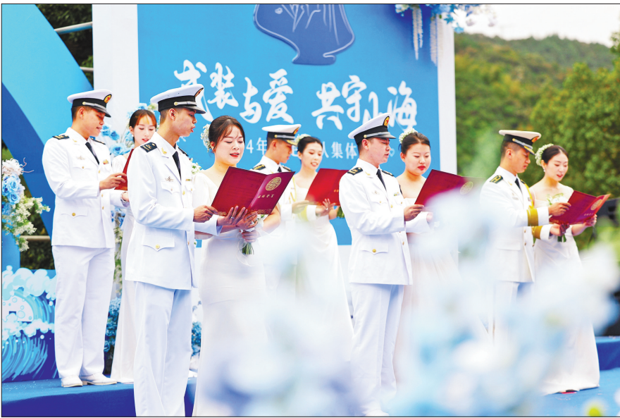
舟山为驻军部队举办集体婚礼。

构建水电油气运等 全链条 保障模式,探索实行军粮 前置配送 分片保障等一站式供应模式,显著提升计划粮精细化保障质效,主动适应部队体制调整、转