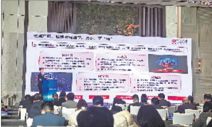
中信银行杭州分行参加“舟山市做好金融五篇文章赋能985行动暨金融服务海洋科技创新工作推进会”。

近期，中信银行杭州分行已制定五年发展目标，要实现科技金融贷款余额突破1000亿元，服务科技型企业超过1.2万家、授信客户超4000户。杭州分行将持续深耕科技产业土壤，陪伴更多科技企业家从追光者成长为发光体。