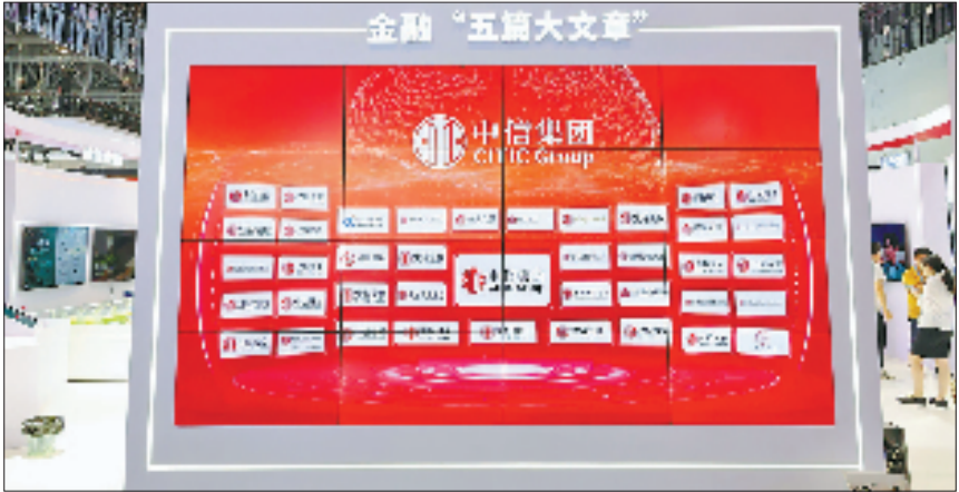
中信集团发挥综合协同优势，做实做优金融“五篇文章”。