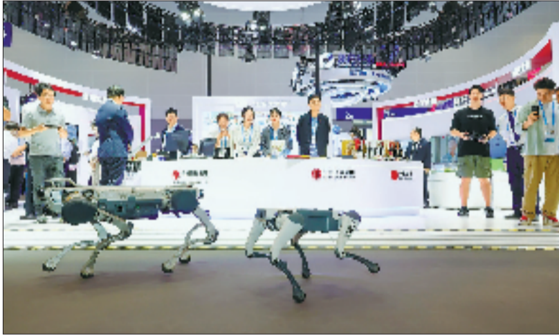
中信银行杭州分行科技金融合作伙伴云深处机器人产品展示。