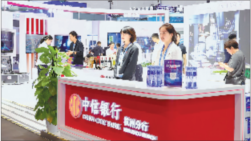
中信银行杭州分行参展全球数贸会。