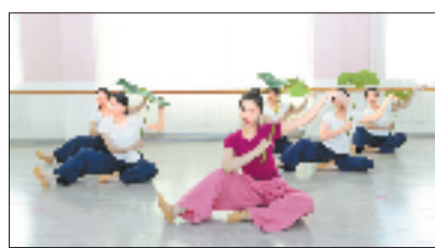
“长霖青创学堂”青年讲师带领学员练习

如今,“长霖青创学堂”成了澄江街道文化振兴的载体。党建引领凝聚力,青年入乡添活力,文化共富暖民心,一幅乡村振兴的鲜活画卷正缓缓铺展。