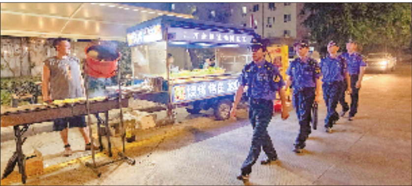
平阳县综合行政执法人员引导流动摊贩有序摆摊