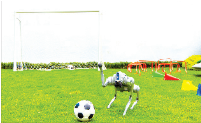
咏山望湖公共空间打造的足球场

当房子不再是冰冷的资产标的，而是成为滋养生活的有机体；当社区从陌生人的集合，转变为有温度的共同体，这场关于“家”的重新定义，正在湖州写下序章。