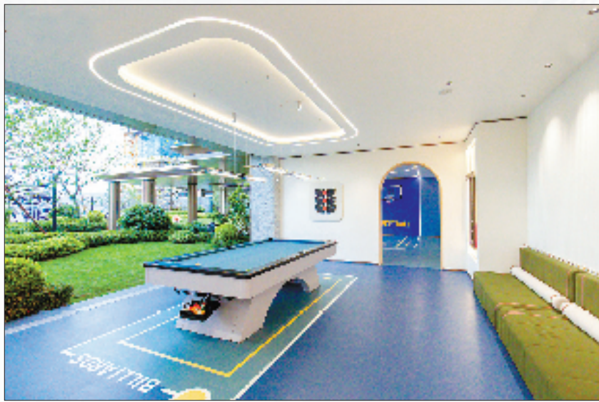
咏山望湖架空层打造的运动区域

在湖州，“好房子”的“颗粒度”越来越细，供给越来越丰富。放眼未来，在住房领域的全新赛道上，湖州正通过多元化的举措，让更多的住宅成为“好房子”，让更多人住上“好房子”。