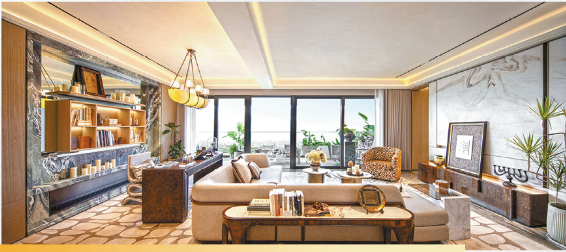
湖州市首批“新一代好房子”示范项目晴屿望湖样板间