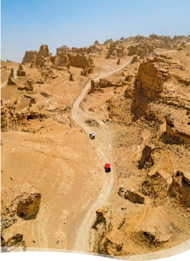
青海省海西州茫崖市冷湖镇火星营地。

奇美、原始、神秘的自然风光,是大自然赐予海西的礼物。但仅仅依赖好景色,没有观光之外的增长点,难以让远方来客长久驻足,更难以建立深层的情感连接。