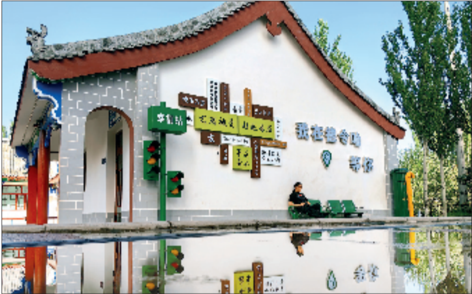
德令哈市海子诗歌陈列馆。