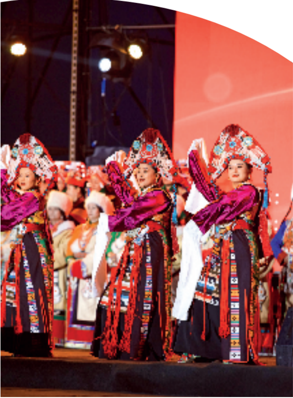
左图:“浙青一家亲 共筑山海情”文化走亲文艺晚会。右图:那达慕大会。

随着海西的各式文旅地标逐渐完善,“西宁—德令哈—大柴旦—敦煌”环线的更多玩法也被开发出来。摊开地图,从西宁出发,一路向西,经过青海湖、翡翠湖、火星营地等景点;折向东北,到达黑独山、莫高窟、鸣沙山;再往东,则有嘉峪关、七彩丹霞——一条丰富的环形路线跃然纸上。